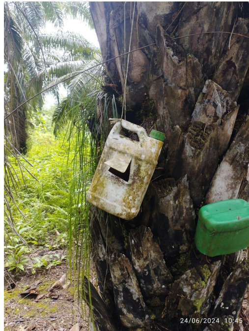
Anexo 2. Trampa para picudo negro en mal estado, encontrada en visita a campo.