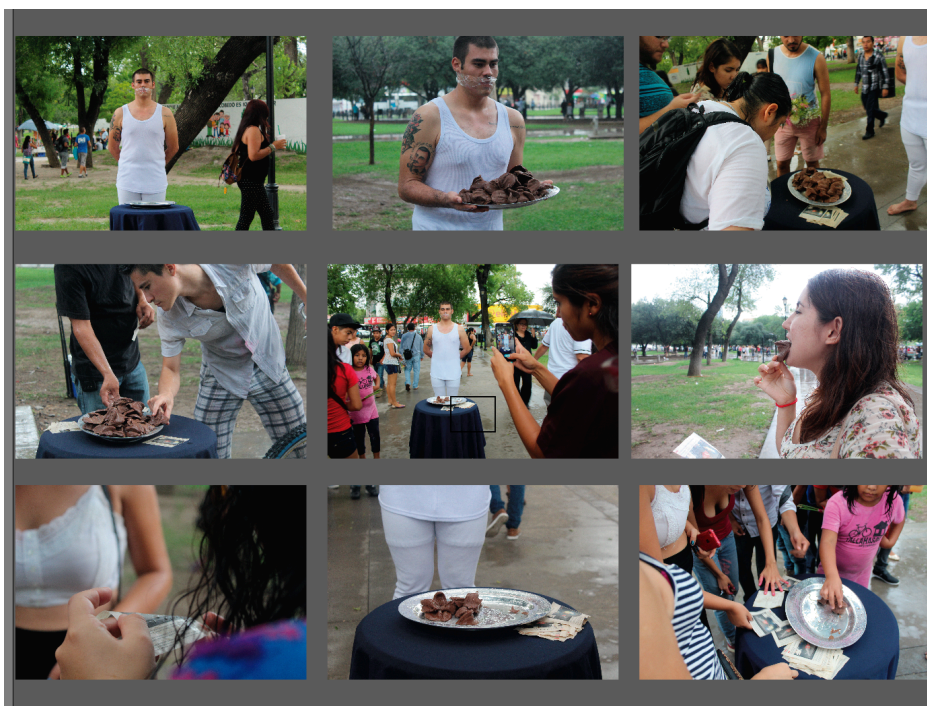
(Registro por la artista Esmeralda Pérez Tamiz)

El proceso de creación consta de dos etapas, la primera en donde se propone elaborar un performance, el cual consiste en servir chocolates al público y que este lo consuma. Los elementos necesarios para que la pieza se lleve a cabo son: chocolates, servilletas, bandeja, mantel y mesa. Una segunda etapa en donde sistematiza el archivo recolectado durante el performance para usar este (archivo) como pieza para el evento especializado.