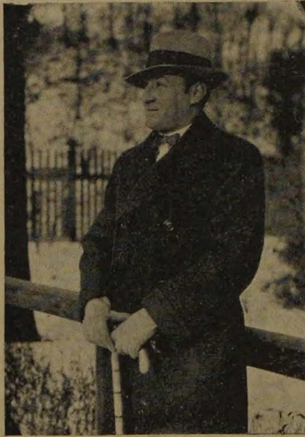
Haya de la Torre