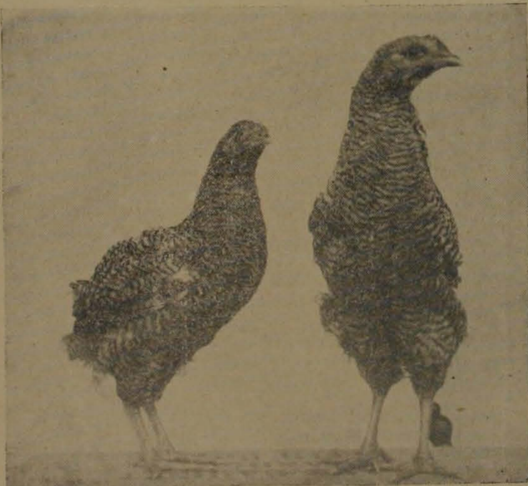
POLLOS DE 4½ MESES DE EDAD

Para el objeto de nuestras investigaciones, escogimos como «donadores» a gallos y gallinas enanos de los mal llamados «Bantam» y conocidos entre nosotros por «jardineros». Si escogimos estas aves fué justamente por no pertenecer a un tronco primitivo único, de pequeño tamaño, sino que, por el contrario, todas las razas, aun las más grandes, tienen representantes entre las enanas, las cuales copian, con carácter hereditario, y como si fuese en modelo reducido, las características de sus antecesores de tamaño normal.