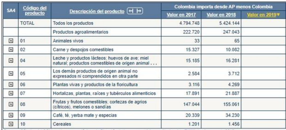
Tabla 4.5 Importaciones de Colombia desde la AP*