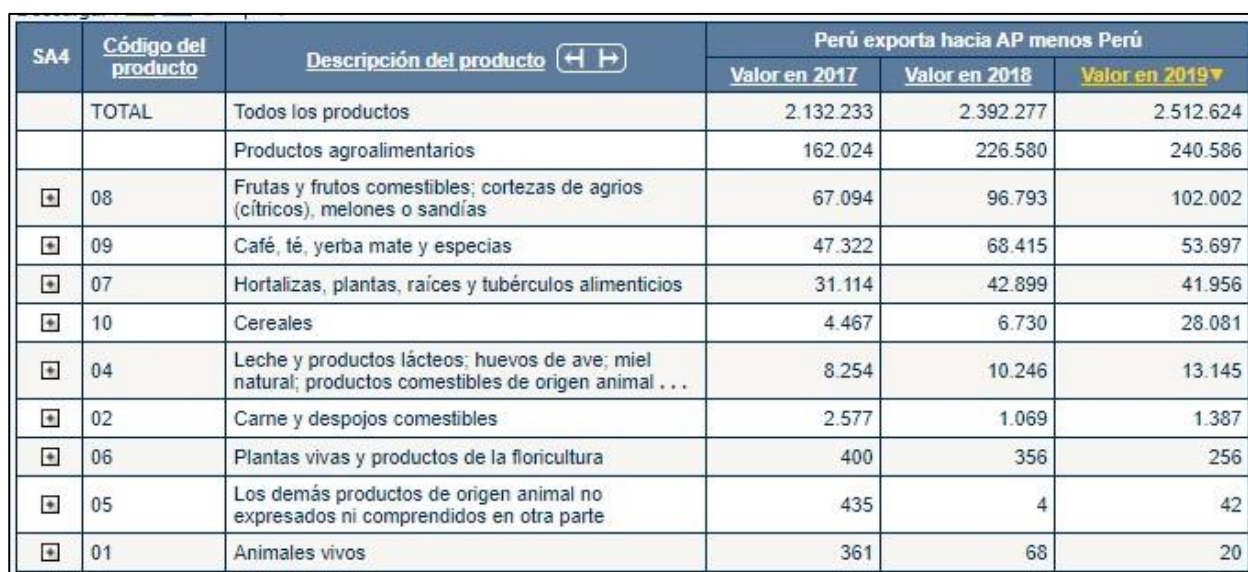
Tabla 4.12 Exportaciones de Perú hacia la AP*

En 2019, Perú exportó a la Alianza del Pacífico 240.586 miles de USD. Según la tabla 3.12, en los últimos tres años, las frutas son sus principales productos con un total de 102.002 miles de USD (para 2019), en específico uvas frescas (41.143 miles de USD). Después, le sigue el café, las hortalizas, plantas, raíces y tubérculos alimenticios. Además, la exportación de cereales aumentó de USD 4.464.000 en 2017 a 28.081.000 en 2019.