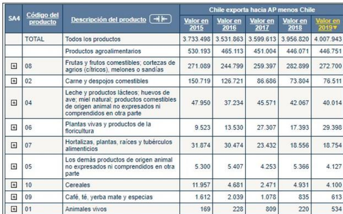
Tabla 4.3 Exportaciones de Chile hacia la AP*

El total de las exportaciones de Chile, correspondiente a productos agrícolas, hacia sus socios de la AP para el año 2019 fue de 446.751 miles de USD y las manzanas frescas como principal producto de exportación representan 100.391 miles de USD.