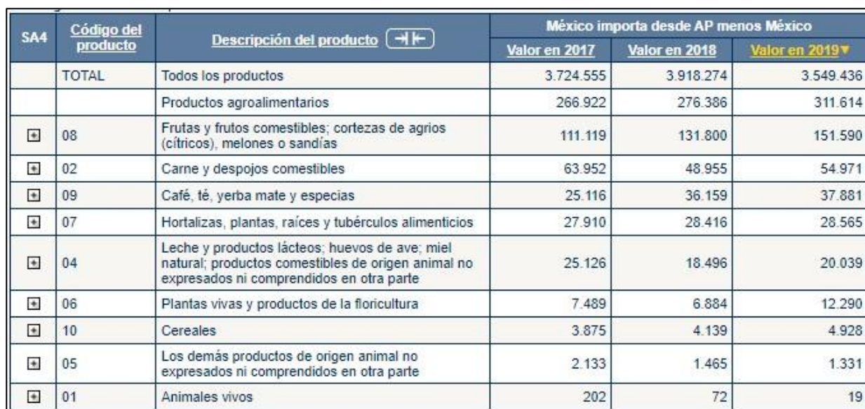
Tabla 4.8 Importaciones de México desde la AP*

México importó, en el 2019, de la AP 31 311.614 miles de USD en productos agrícolas, más que todo frutas frescas (151.590 miles de USD). Las uvas frescas representaron el principal producto con un total de 51.924 miles de USD.