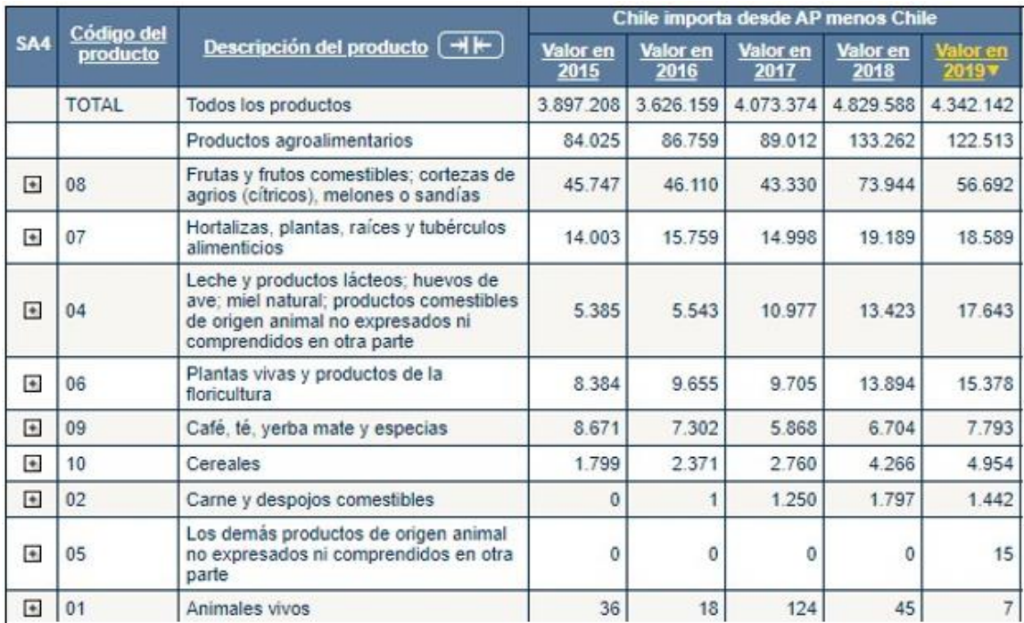
Tabla 4.2 Importaciones de Chile desde la AP*