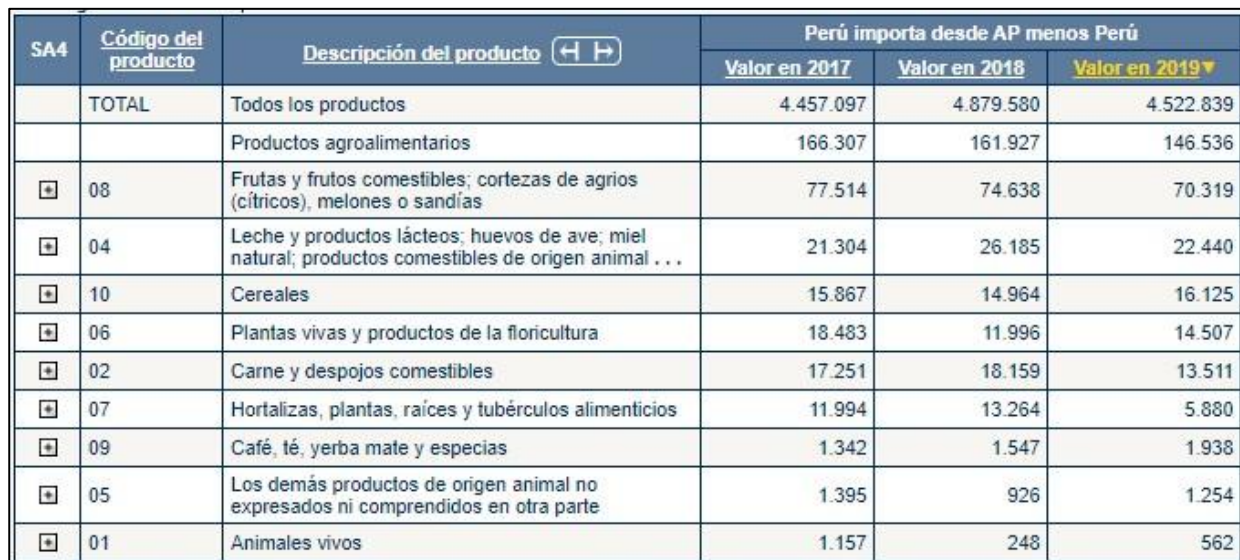
Tabla 4.11 Importaciones de Perú desde la AP*

Perú importó de la AP en el año 2019 la suma de 146.536 miles de USD, de los 70.319 miles de USD es el equivalente a frutas frescas y las manzanas es de 30.715 miles de USD.