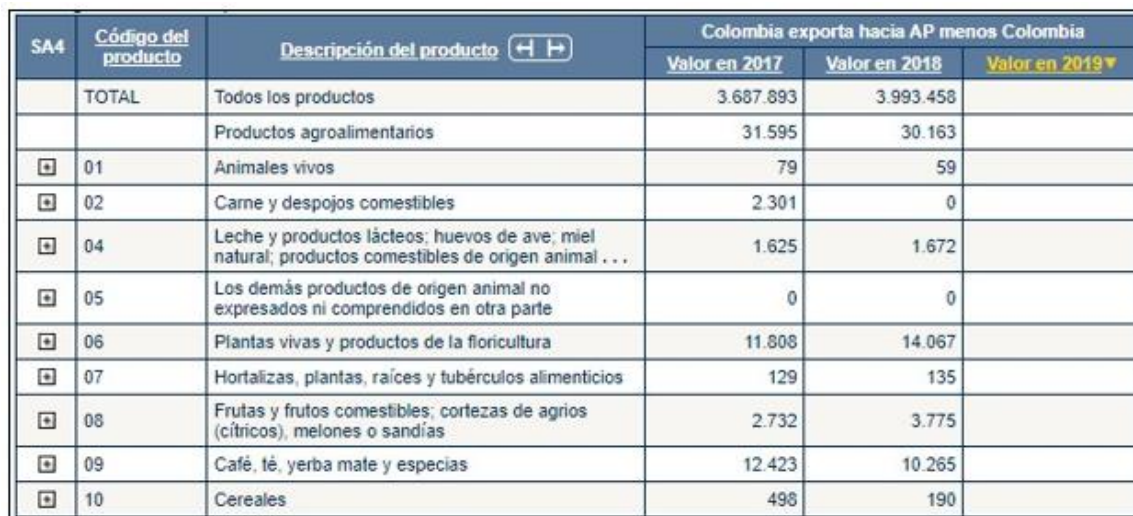
Tabla 4.6 Exportaciones de Colombia hacia la AP*

Colombia exportó en el 2018 un total de 30.163 miles de USD hacia sus socios comerciales de la AP, siendo las plantas vivas el principal producto de exportación, específicamente los crisantemos, los cuales representan un total de 11.505 miles de USD.