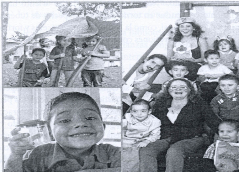
Imagen 1 Participantes de los ecotalleres impartidos en la Biblioteca Infantil Miriam Álvarez Brenes. Heredia, Costa Rica