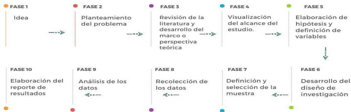
Figura 1. Fases a seguir para el método de investigación cuantitativo.

El método de investigación en el que se basa este estudio es el cuantitativo, seleccionado por su idoneidad para abordar los objetivos planteados, a continuación, se muestra la ruta y procedimientos a seguir, según Hernández y Mendoza (2018).