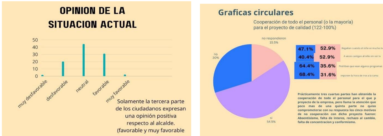
Figura 8. Ejemplo de presentación de datos.

Según Hernández et al. (2014) “Las distribuciones de frecuencias, especialmente cuando utilizamos los porcentajes, pueden presentarse en forma de histogramas o gráficas de otro tipo (por ejemplo: de pastel)”. (p.285)