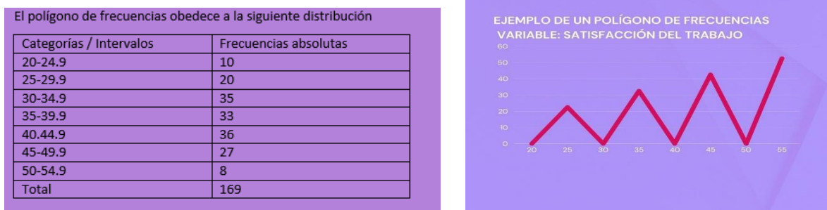
Figura 9. Ejemplo de presentación de datos en polígonos.

Los polígonos de frecuencias representan curvas útiles para describir los datos.