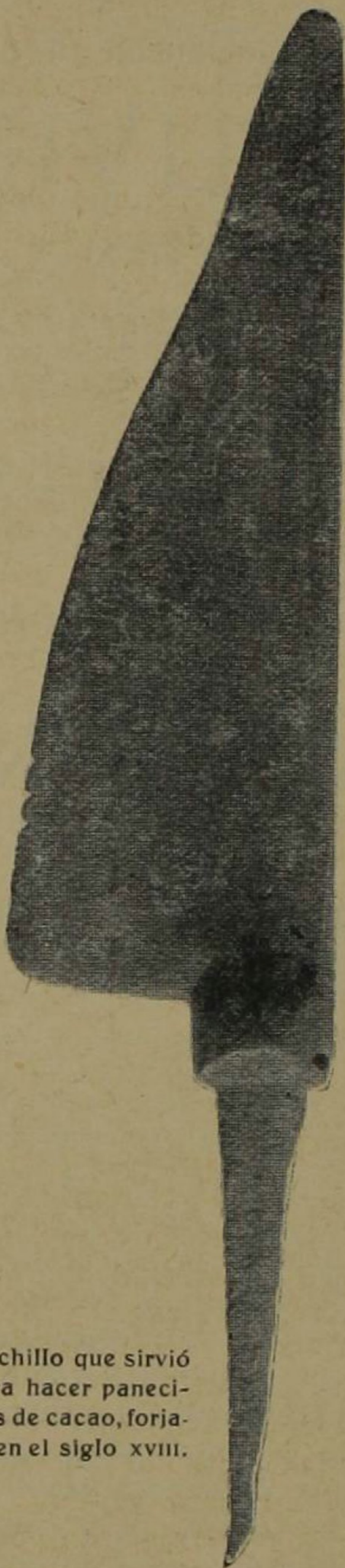
Cuchillo que sirvió para hacer panecillos de cacao, forjado en el siglo xviii.