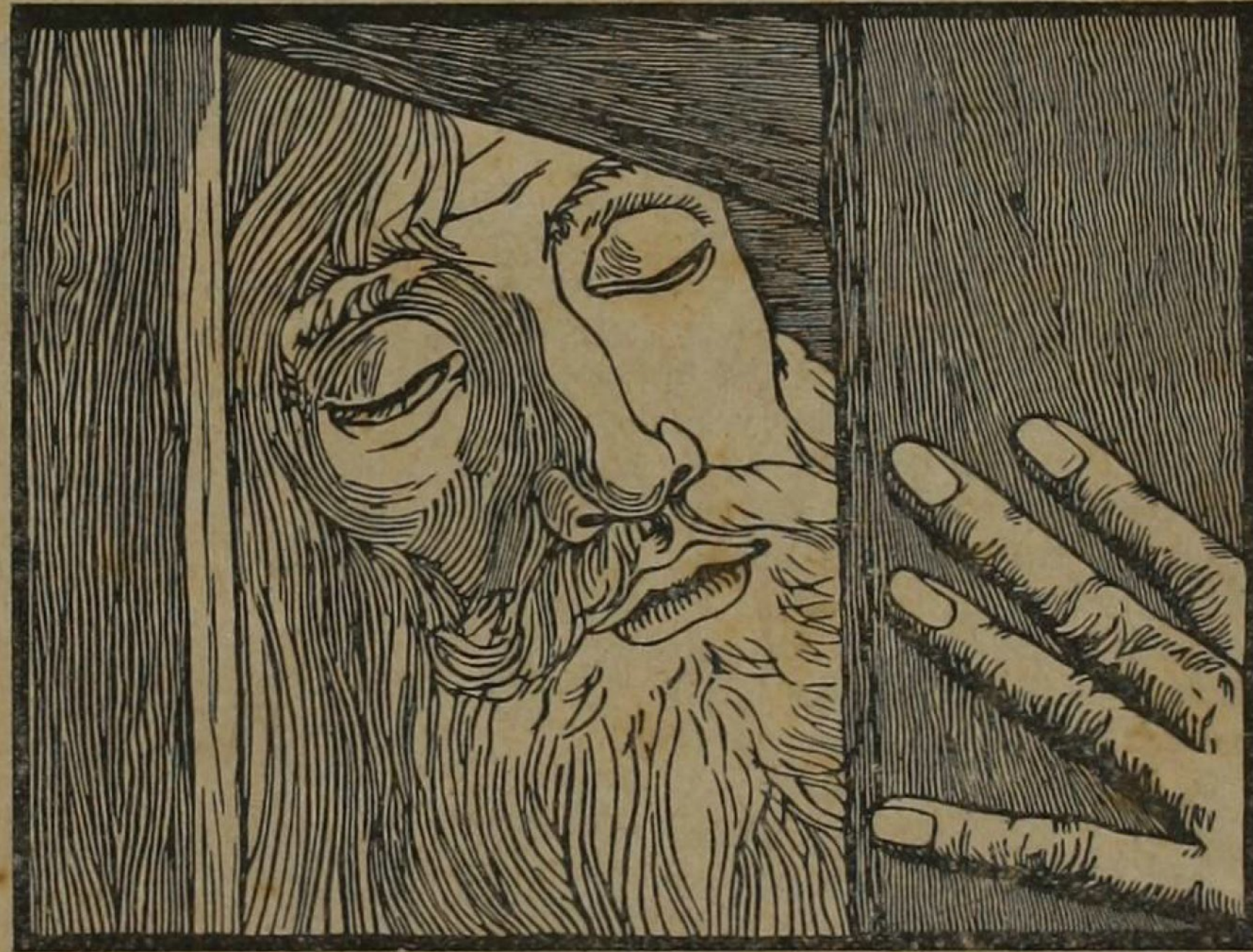
Cabeza de Cristo

Gracias te doy, dulce Jesús, que conversando con los hombres, quisiste benignísimamente consolarlos, y con muchos milagros curar misericordiosamente sus enfermedades. Dame corazón lleno de afición piadosa con todos, y de sancta compasión, para que me compadezca de las aflicciones de todos, y sienta las miserias ajenas como las mías propias, y sufra con igual corazón las imperfecciones de todos, y socorra alegremente cuanto pudiere a sus necesidades. Limpia, Señor, y sa-