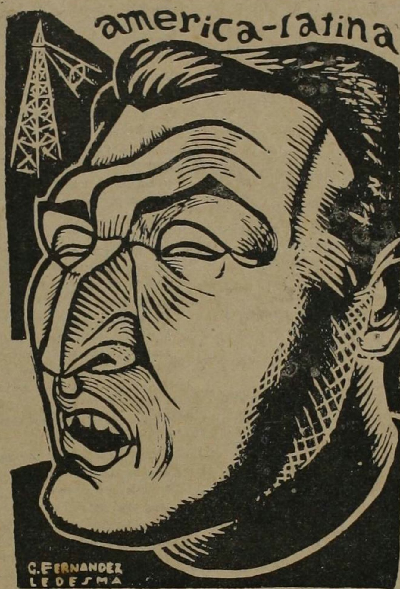
Haya de la Torre