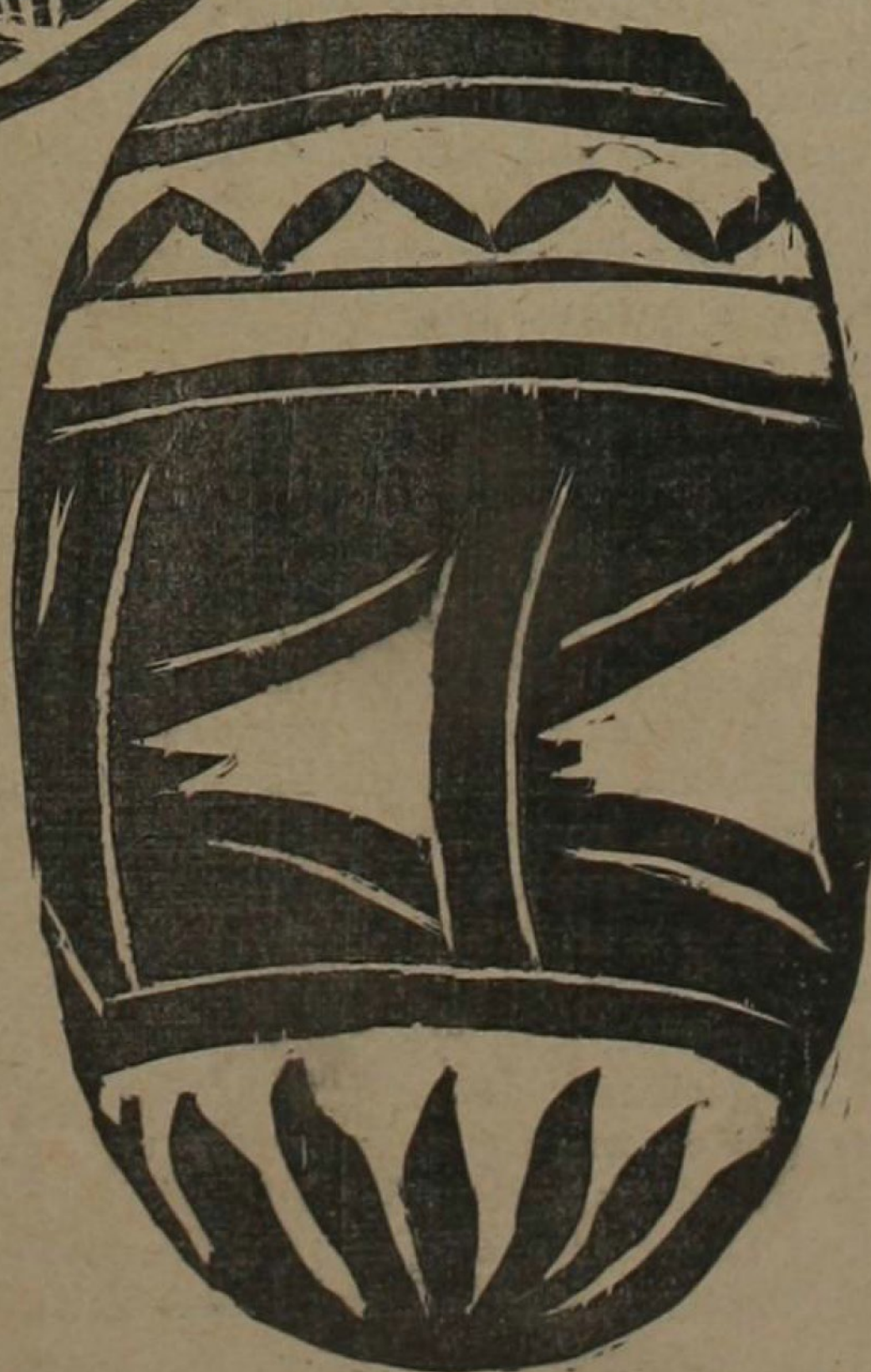
Jícara "labrada" procedente de Orotina. (Provincia de Puntarenas)

(Del libro en preparación: Las Artes Plásticas en Costa Rica )