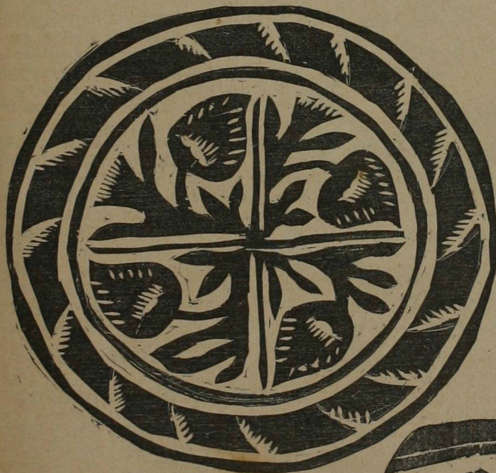
Decoración esgrafiada en un huacal, por Agustina de Morales. (Puntarenas)