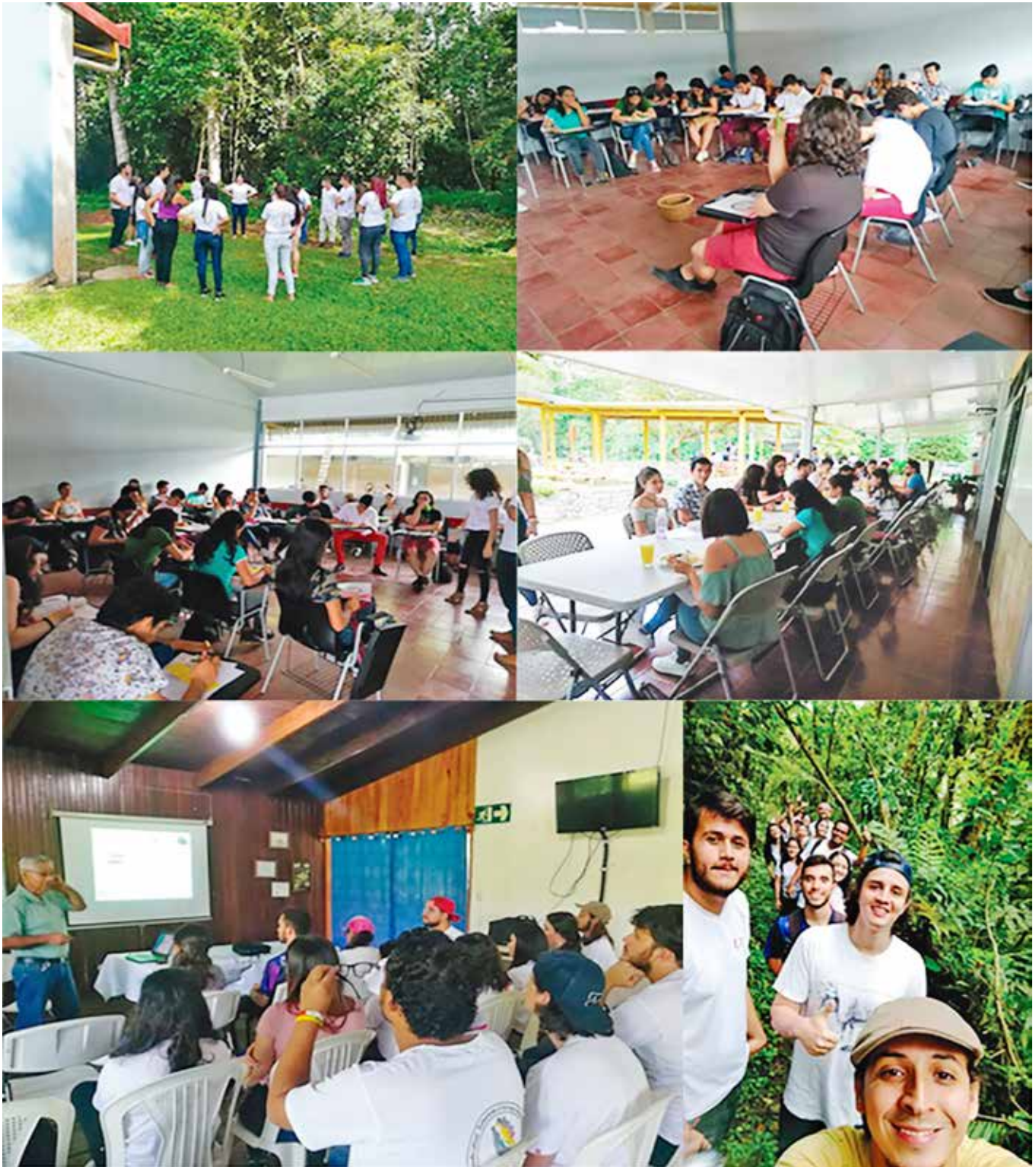
Figura B3. Sesiones de trabajo Pérez Zeledón. Sesiones de Trabajo Corredores e Invitaciones Especiales: