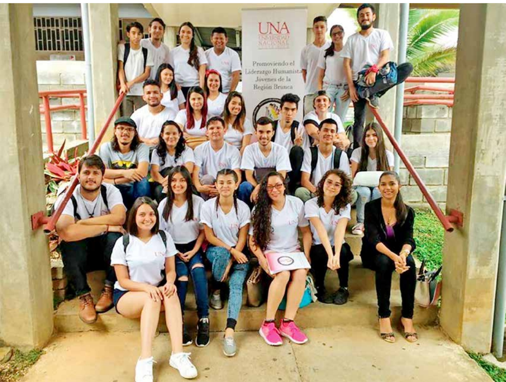
Figura B1. Grupo de personas participantes en Pérez Zeledón.