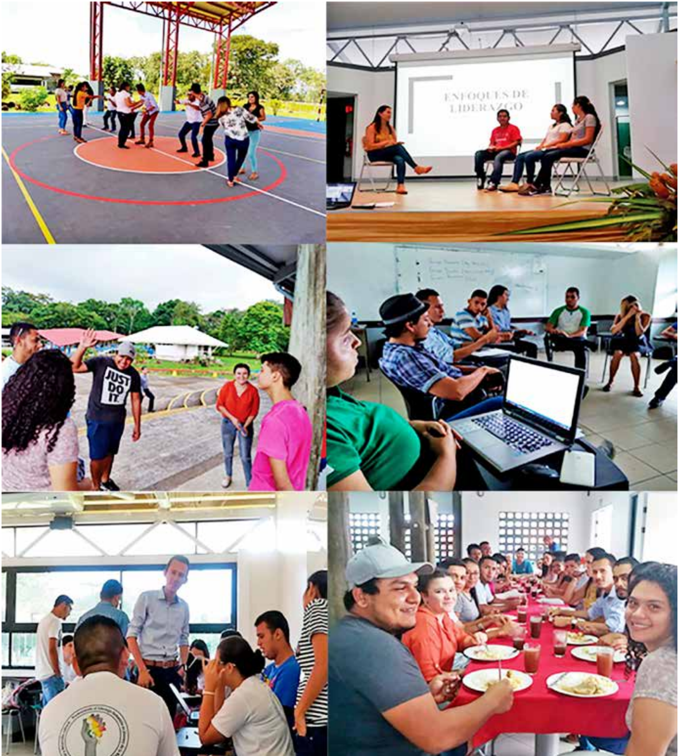
Figura B4. Sesiones de talleres del Proyecto.