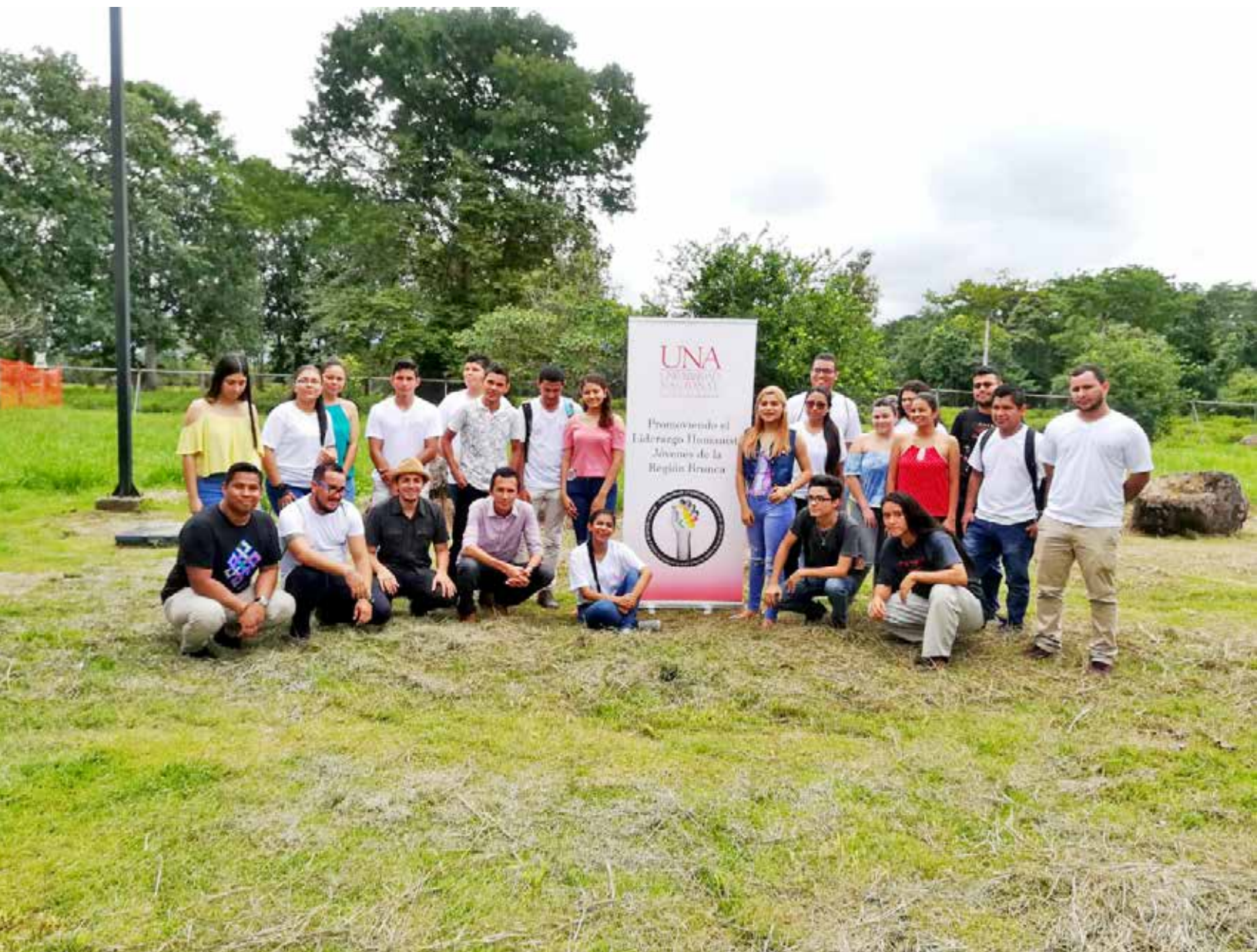
Figura B2. Grupo de personas participantes en Corredores.