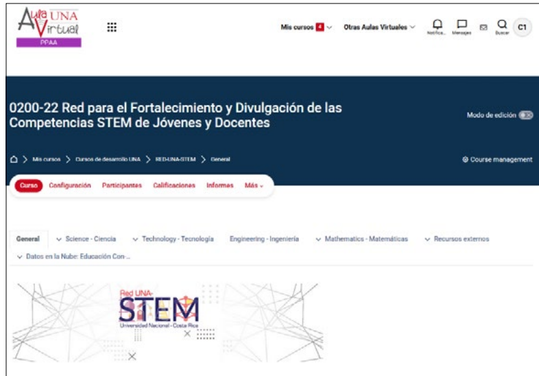
Imagen 2. Aula Virtual

Al mes de setiembre del 2025 se han desarrollado los siguientes materiales: