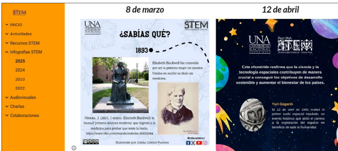
Imagen 1. Sitio Web

Asimismo, la gestión eficiente de los materiales digitales promueve la equidad en el acceso a la educación, al poner a disposición de toda la comunidad educativa recursos en diversos formatos y plataformas. En este apartado la Red UNA STEM pone a disposición un conjunto de recursos educativos tanto en su sitio web 39 como en el Aula Virtual.