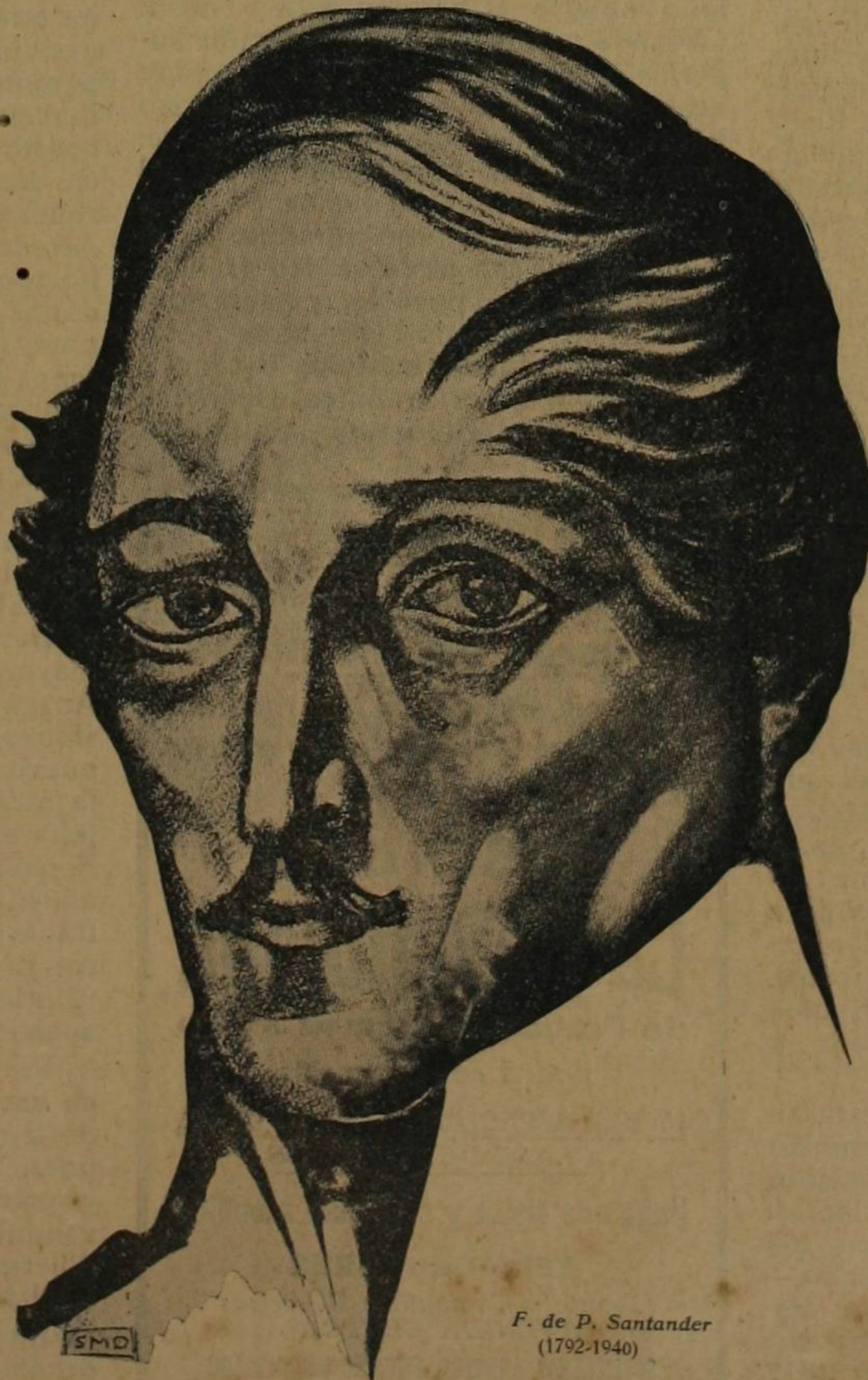
F. de P. Santander (1792-1940)

(Fragmento de un estudio escrito en 1881-82. En el Papel Periódico Ilustrado de Bogotá)