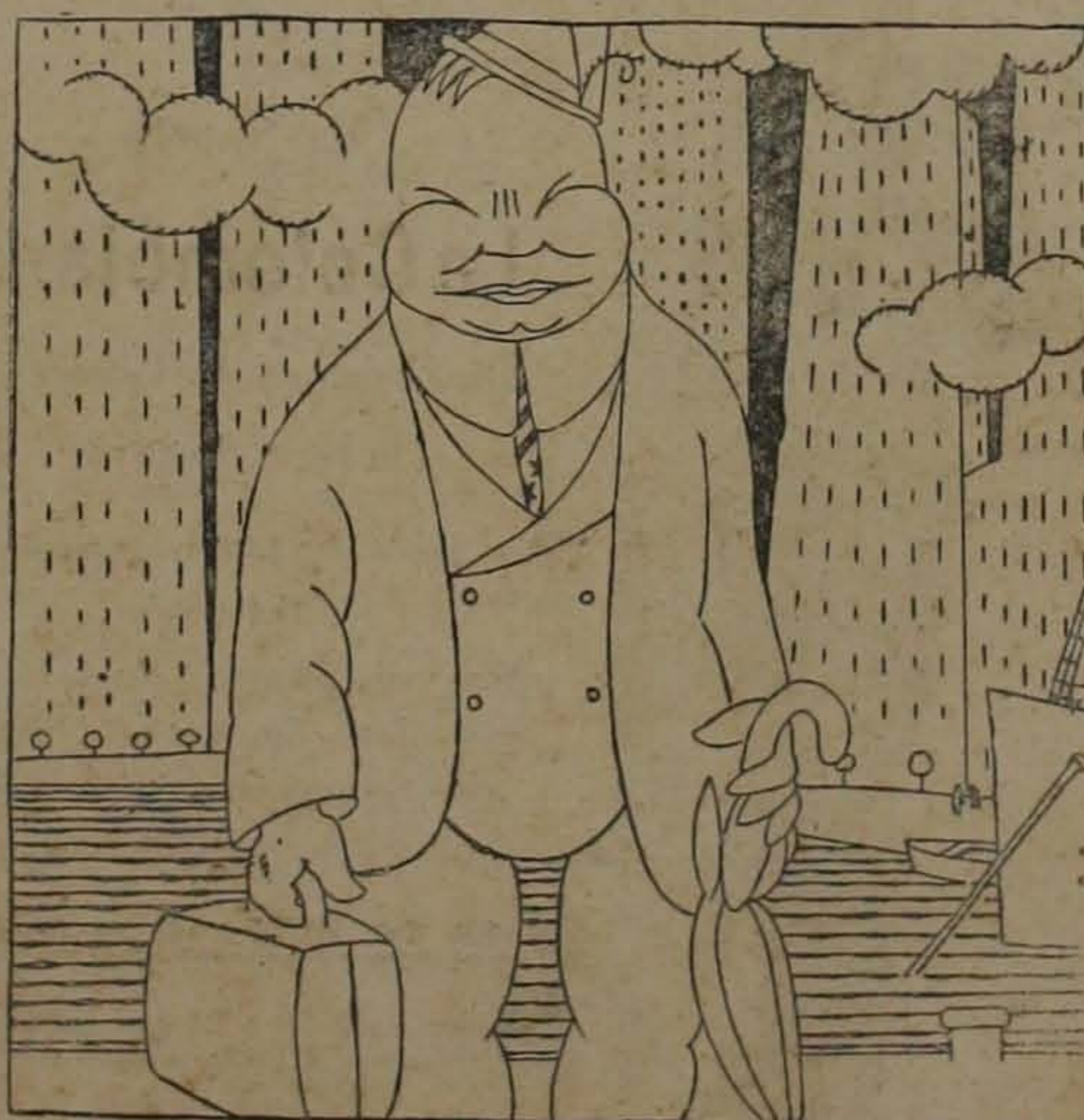
Hoover, camino de la América española: —Seamos el primer comerciante, para poder seguir siendo el primer prestancista.