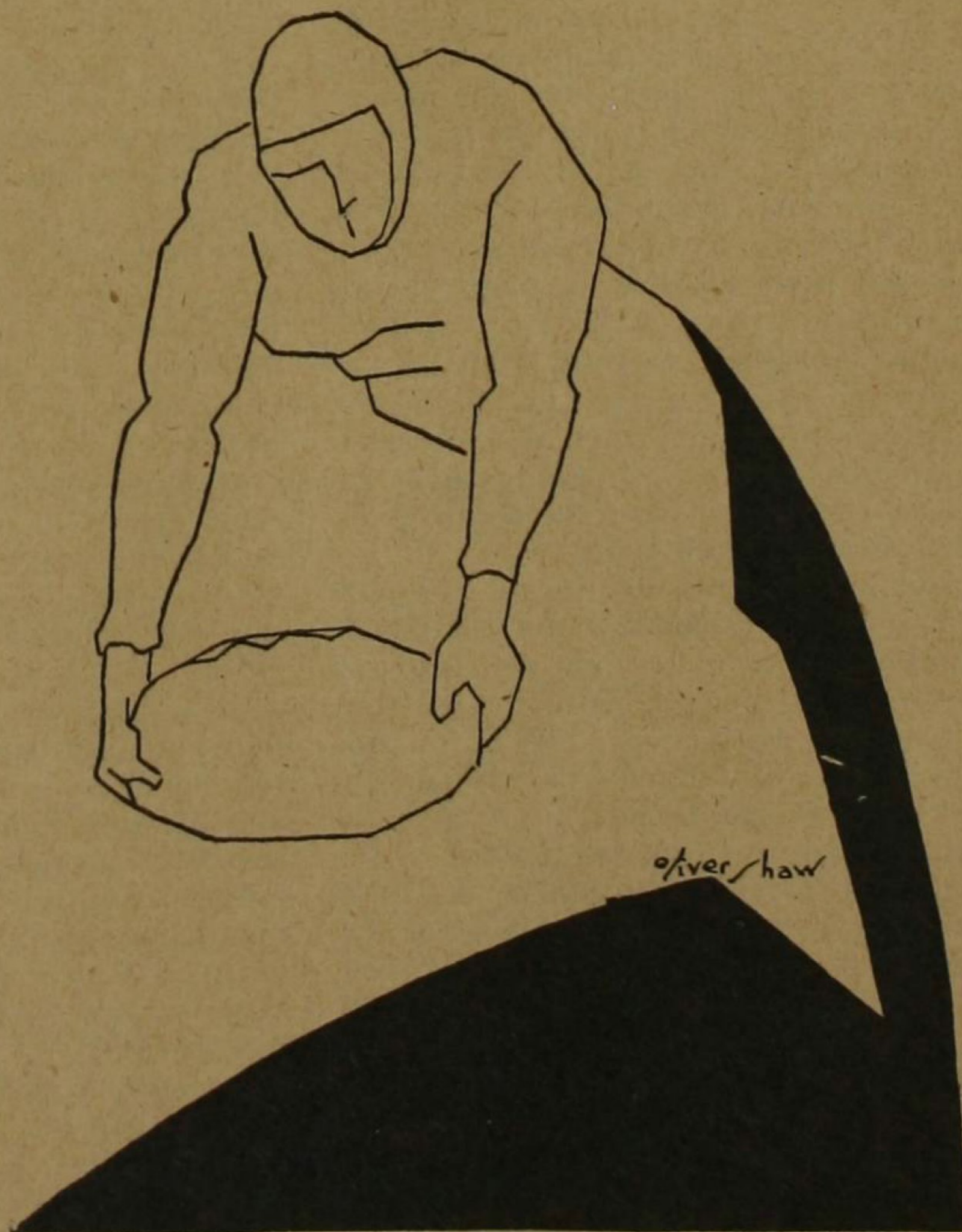
Jugador de foot-ball