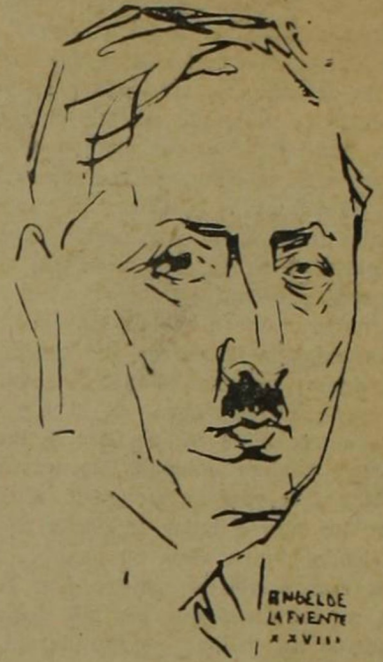
Alfonso Hernández Catá

Este acabamiento súbito, en la posesión de todas las potencias y sin rendir la mejor tarea, otorga al caso de Hernández Catá una significación viviente, activa, dinámica. Yo he imaginado,—imaginar es un deber frente a un imaginador insuperable,— que el modo de muerte que le tocó, y que con tanta justicia nos aflige, hubiera sido para él, en su perfil simbólico, muerte querida. El nos dió su mejor libro en La Muerte Nueva . Lo fué la suya, pero en un sentido distinto y opuesto al de su narración hermosísima. En su novela hay un acabamiento consciente, una sombría renuncia anticipada: se siente, bajo la piel de los héroes solitarios, el hervor pugnaz de la vida, se toca el curso de la sangre eficaz y a todo se oprime con piedra de sepulcro: la muerte nueva, la muerte en la vida, en el latido animal que en soliloquio amargo ha renunciado a sus deberes. La muerte de Alfonso Hernández Catá es, en cambio, como una vida nueva; es un vuelo que se rompe en el instante de alcanzar el más alto objetivo, es el ímpetu maduro y firme que muere viviente, inacabado, operante, inmortal. Ni la muerte cuando no hemos dado