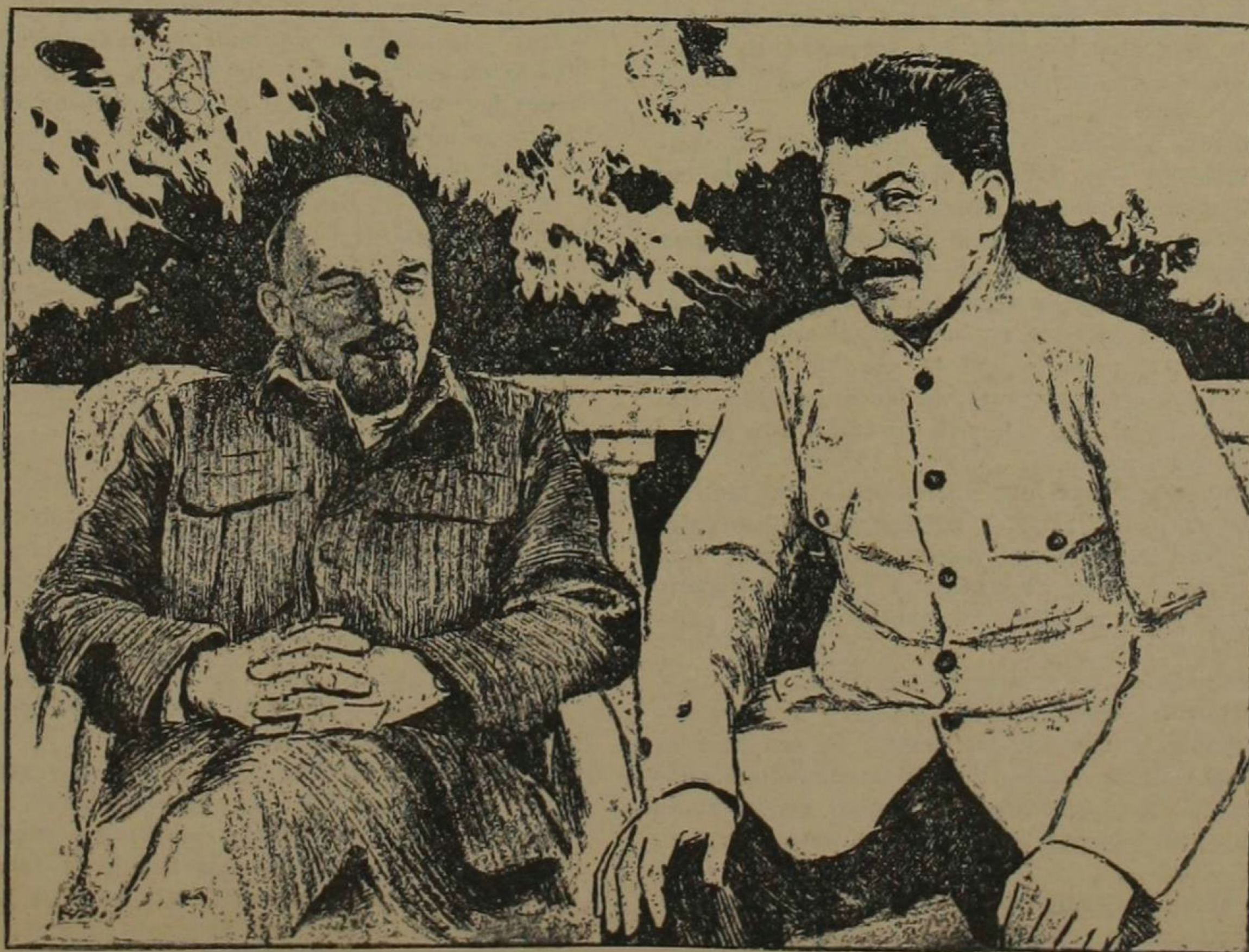
Lenin conversa, en el jardín de su residencia, con Stalin.

Y somos la mujer que en las auroras plancha, la que cose su noche a cada nuevo día, la que niños enseña, la que canciones canta, unidas a los hombres de la vega y la ría.