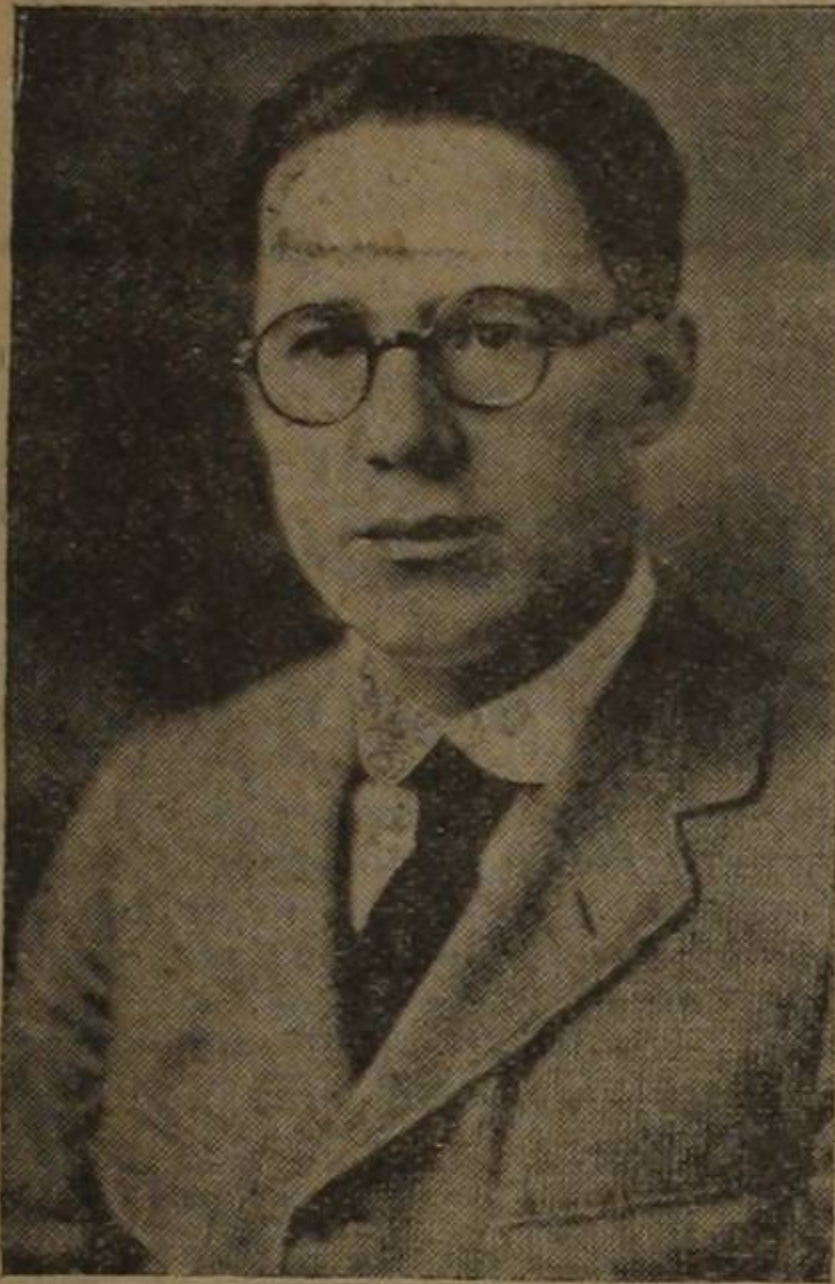
ARTURO TORRES RIOSECO

EN las Ediciones del REPERTORIO se ha publicado, con el título de Poetas Norteamericanos : WHITMAN.