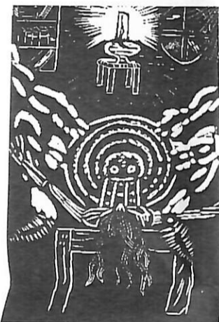
...fue entrando lentamente en un sopor mitad sensual mitad místico... Max Jiménez, pág. 352 (pág. 351)

Un Redentor... un Redentor... Termina la obra. ¿Un redentor? El Sabio pulga humanizado reta a su "salvador":