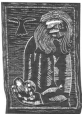
El domador de pulgas (pág. 269)