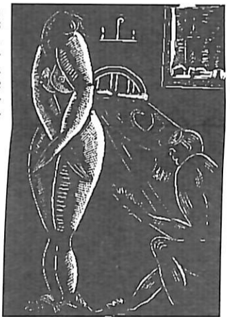
El filósofo sexual y la pulga puta (pág. 297)

Como ese filósofo sexual, Max Jiménez se deja ir por entero, casi en forma autobiográfica, en el episodio llamado La pulga artista.