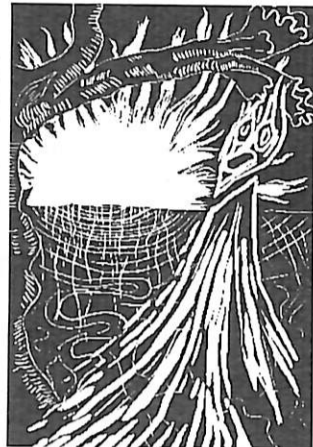
El alto de una pulga que estaba solo (pág. 316) 5

...sus personajes son seres desdoblados o alienados, desposeídos de conciencia y voluntad, inmersos en un orden social que funciona como un mecanismo enajenante, que los lleva a repetir de manera inconsciente o involuntaria, actos o gestos sin sentido, esperpénticos o bestiales. Quesada Soto, 1979, pág. 49.