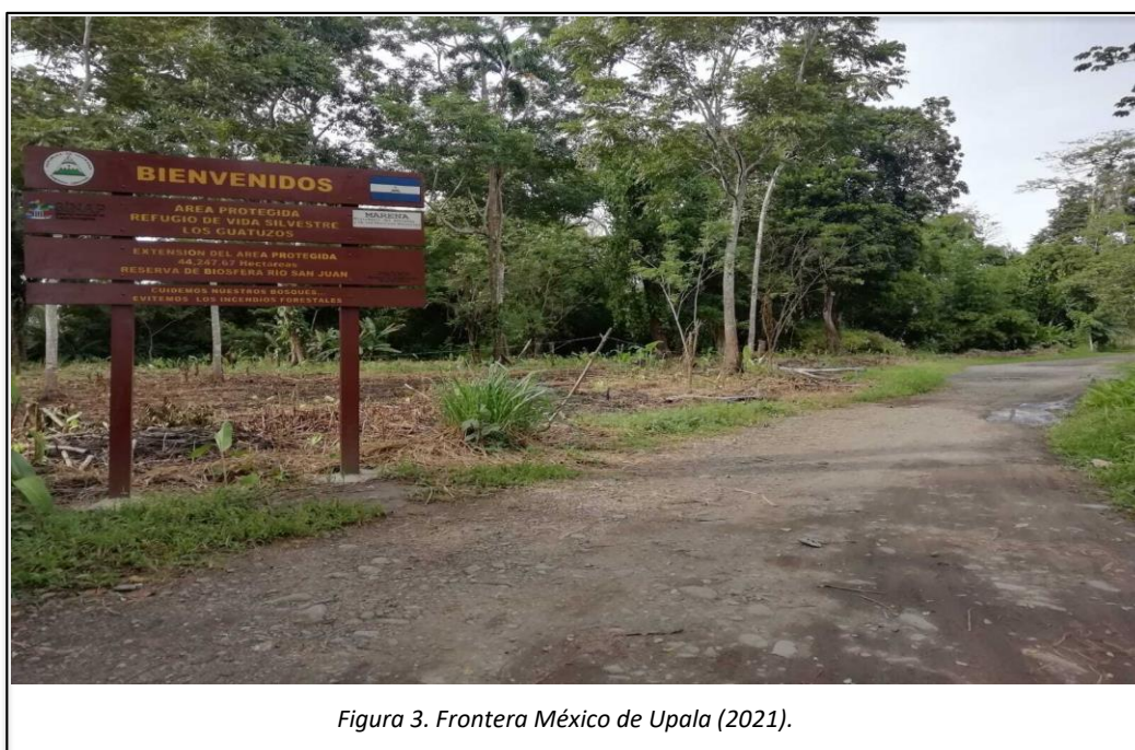
Figura 3. Frontera México de Upala (2021).

Así también, padres de familia que viven en el territorio nicaragüense y tienen matriculados a sus hijos e hijas en escuelas fronterizas del cantón de Upala, mencionan: “mando a mi hijo a esta escuela porque va a estar más preparado para ir al colegio” (entrevista 14, 13, apéndice G) asimismo, otro entrevistado señaló: “facilidad de acceso a ayudas económicas” (entrevistado 14, apéndice G). En cuanto a las y los estudiantes que están cursando en el colegio muchas familias prefieren mandar a sus hijos e hijas a los colegios técnicos a pesar de las largas distancias así lo afirma un miembro de la comunidad educativa, al expresar “prefiero mandar a mi hijo a otro colegio, aunque tenga que madrugar para que tenga la oportunidad de tener un técnico” (entrevistado 15, apéndice G).