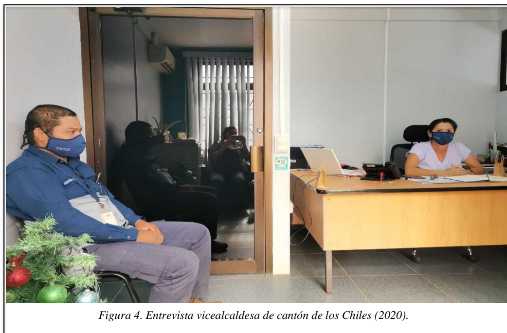
Figura 4. Entrevista vicealcaldesa de cantón de los Chiles (2020).

No se ve ninguna presencia de universidades en los pueblos en las zonas rurales una cosa es Los Chiles centro otra cosa es la trocha, su publicidad es más que todo es enfocado en las partes más céntricas parte metropolitana cantón de Los Chiles, si un chico quiere estudiar tiene que buscar y salir de su pueblo (líder comunal).