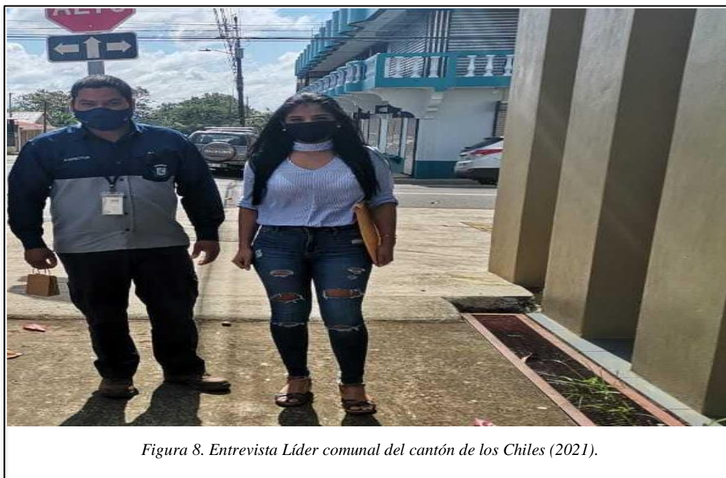
Figura 8. Entrevista Líder comunal del cantón de los Chiles (2021).

Lo expuesto, se refuerza con lo planteado por un funcionario municipal, quien expresa que “es necesario atender las necesidades de la población que requiere atención en primaria y universitaria, son pocas las personas que ingresan a las universidades”, (entrevistado 10, apéndice F); por ello, atender a la población en el nivel universitario es fundamental para generar progreso. En el territorio fronterizo el porcentaje de la conclusión de estudios de las personas jóvenes sigue siendo mínima, así también se señala que “personas entre 18 y 24 años que asisten a la educación superior en la región huetar norte fue de 15.9% en el año 2016”(Sexto informe del estado de la educación, 2017, p. 251); Además se destaca que “el 60% de la población en el territorio fronterizo no cuenta con primaria completa lo que tiene impacto en la zona, son pocos los lugares donde los estudiantes logran concluir la secundaria e ir a la universidad” (entrevistado 23, apéndice H), de acuerdo con un funcionario municipal, el cual expresa que “nos gustaría una universidad que brinde más carreras para una población olvidada o para aquellos jóvenes que se trasladan, para que no tengan que ir a otros lugares a estudiar” (entrevista 11, apéndice F).