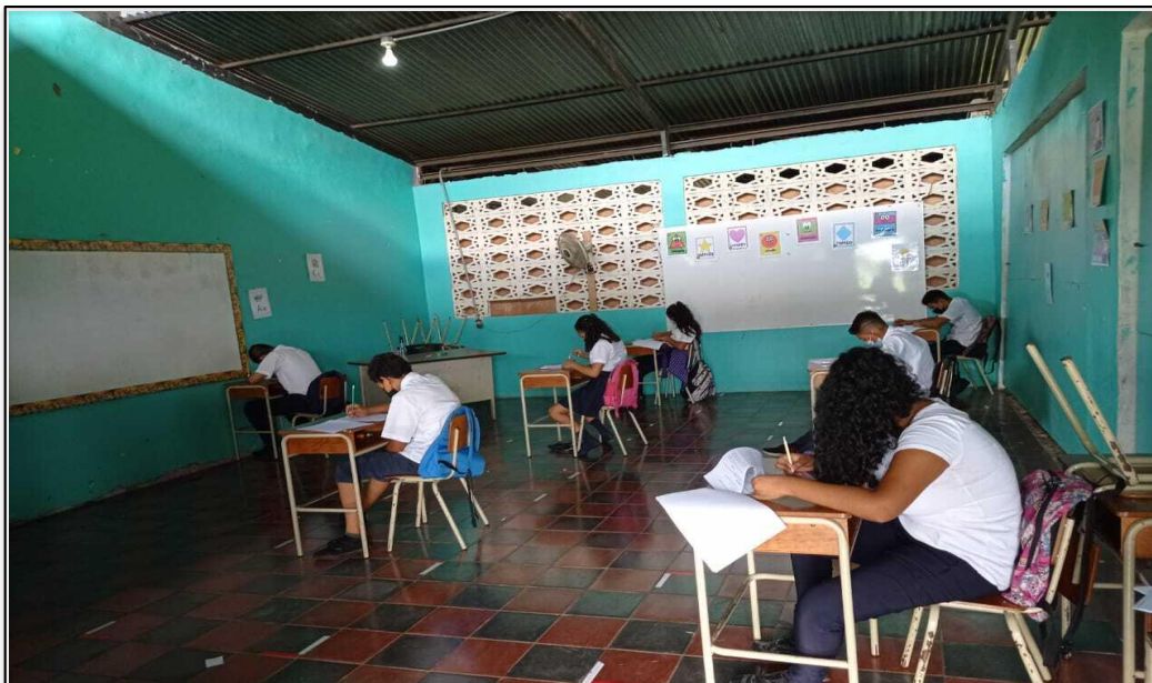
Figura 6. Infraestructura en mal estado (2021)

En este aspecto, líderes comunales expresan que “debería existir más apoyo a instituciones escolares y secundarias, y más inversión en preespecialidad 4 del área universitaria en las zonas transfronterizas”( entrevista 28); así mismo, el entrevistado 30 señala que por parte del gobierno hace falta “volcar la mirada hacia la mejora en educación considerando y valorando las necesidades o adversidades que se enfrentan” (apéndice I), debido a esto se reconoce la escasa inversión en mejoras sociales para el territorio fronterizo, “el problema radica en que aún prevalecen visiones acerca de lo rural que poco se ajustan a las nuevas dinámicas de estas comunidades” (Salas, Ortiz y Trejos, 2020, párr. 11).