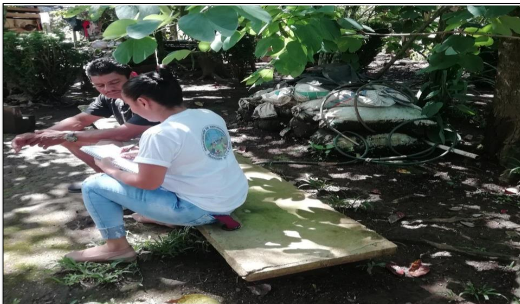
Figura 7. Líder comunal del Cantón de Upala (2021).

Tal y como afirman las y los líderes comunales sobre la oferta en educación superior (apéndice I), “son buenas pero la ayuda va más para las escuelas y colegios, que para la implantación o promoción del servicio formativo universitario”(entrevistados 26); además, “hace falta más apoyo en el área universitaria para la formación de jóvenes al salir del colegio y que no queden en el aire” (entrevistados 27), debido a lo anterior, se puede sustentar que existe carencia en la oferta de educación superior y no existe la cobertura deseada, donde se aplique el criterio de acceso “desde la educación inicial hasta la Educación Superior” (OCDE, 2017, p. 4).