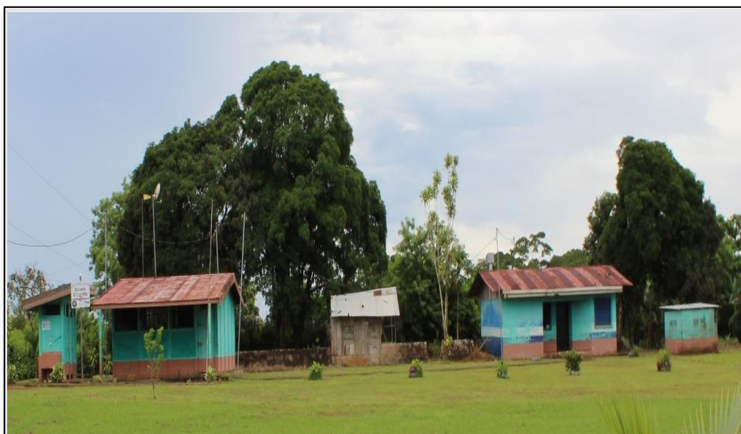
Figura 4. Escuela El Cachito, Los Chiles (2021).

Cuando se piensa en la democratización de la educación y su acceso, se apunta a lo planteado por Fernández (2016), “la educación como un servicio que llega a muchos rincones del país, con poca población de niños y largas distancias entre centros educativos vecinos” (p. 61). No obstante, a pesar de existir alta cobertura, los niños y las niñas enfrentan la dificultad de la lejanía de las escuelas fronterizas, por tanto, se debe analizar, cómo se transportan las y los estudiantes para llegar a la escuela, con qué recursos, la edad del o la estudiante; si es acompañado, entre otros aspectos, que interfieren con su acceso a la educación formal.