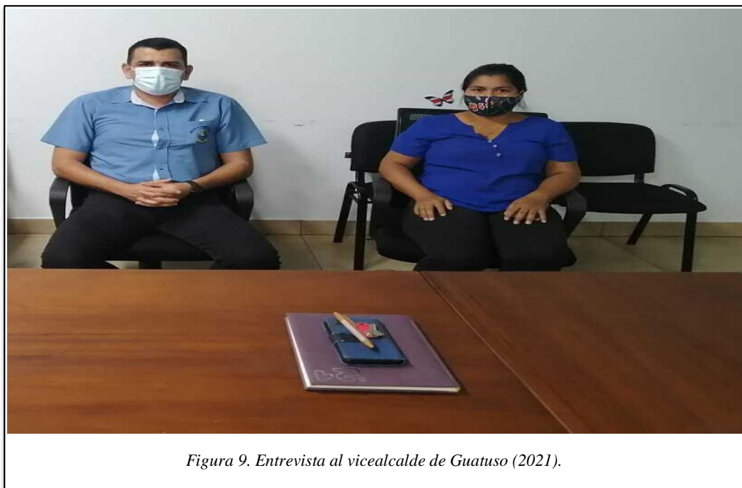
Figura 9. Entrevista al vicealcalde de Guatuso (2021).

“se están trabajando en propuestas educativas a nivel de educación superior con universidades públicas en beneficio del territorio (entrevista 11,12, apéndice F), por lo que, “la educación constituye una herramienta fundamental para la reconstrucción de procesos identitarios que contribuyan a la revalorización de lo rural” (Salas, Ortiz y Trejos 2020, p. 172).