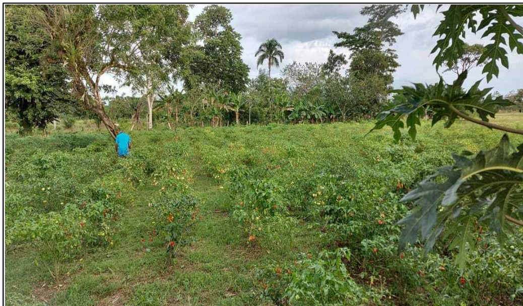
Figura 2. Actividades agrícolas (2021).

Al respecto, el entrevistado líder comunal, denota que “las personas se desempeñan muy orgullosamente en actividades agrícolas que es lo que genera ingresos en la zona, lo que permite llevar el sustento al hogar y sufragar los gastos básicos”, igualmente, se aprecia la mujer rural fronteriza, como un factor de apoyo determinante para el éxito educativo de niños y niñas; en la comprensión del valor y aporte de los padres de familia en el apoyo del proceso educativo de los niños y niñas, en la cual se requiere una visión compartida entre el trabajo en el hogar, labores en el campo y la formación continua de sus hijos e hijas, de acuerdo con el entrevistado expresa “destacó las labores de la mujer campesina que en algunas ocasiones solo acompañada de sus hijos lucha por sacarlos adelante, así como en el hogar alimentando y procurando para que estén bien y tengan la oportunidad de asistir a la escuela” (entrevistado 29, apéndice I).