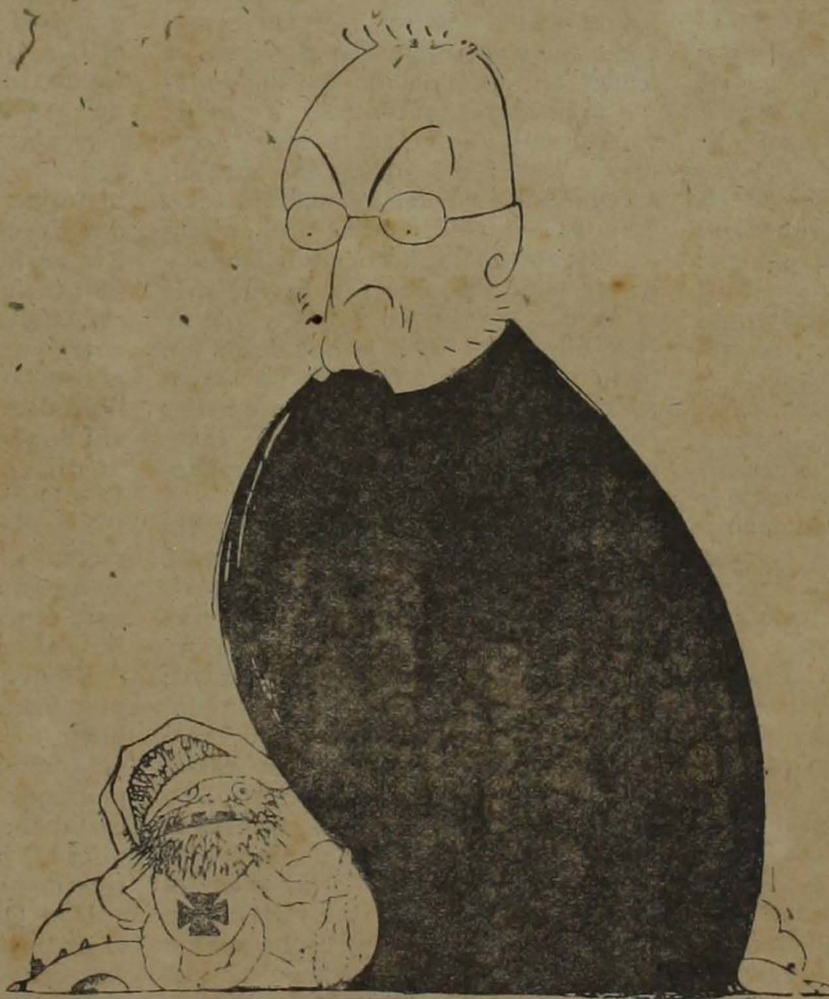
La garra de UNAMUNO apretando el cráneo microcéfalo de un troglodita germanófilo español

El libro de Cervantes, como todos los libros verdaderamente profundos— como, por ejemplo, la Odisea , las Las mil y una noches y los Viajes de Gulliver — puede darse a los niños para entretenimiento y puede servir como texto a un filósofo, para una teoría acerca de la vida. Está en él, la corteza, el sentido literal, que agrada al gusto de los niños de diez años y a los doctos de sesenta, y está en él el germen, la substantifique moëlle , que cita Rabelais, y que tan sólo los hombres suficientemente grandes, para no sentir contrariedad por bromas y absurdidades, pueden sorber hasta el fin. ¡Cuánta sabiduría existe para quien la supiera buscar, en la literatura popular burlesca de todos los países y de todos los siglos! Tras las facecias, los chistes graciosos hallas a menudo la sátira exacta; al finar de aventuras inverosímiles, una crítica de la realidad; en medio de la locura más escandalosa, das con la revelación imprevista de alguna verdad paradójal más exacta que muchas sentencias ratificadas por los autorizados. Podríase construir la filosofía de los espíritus sencillos, de los pobres de espíritu y de los demasiado listos, que no tendrían de qué