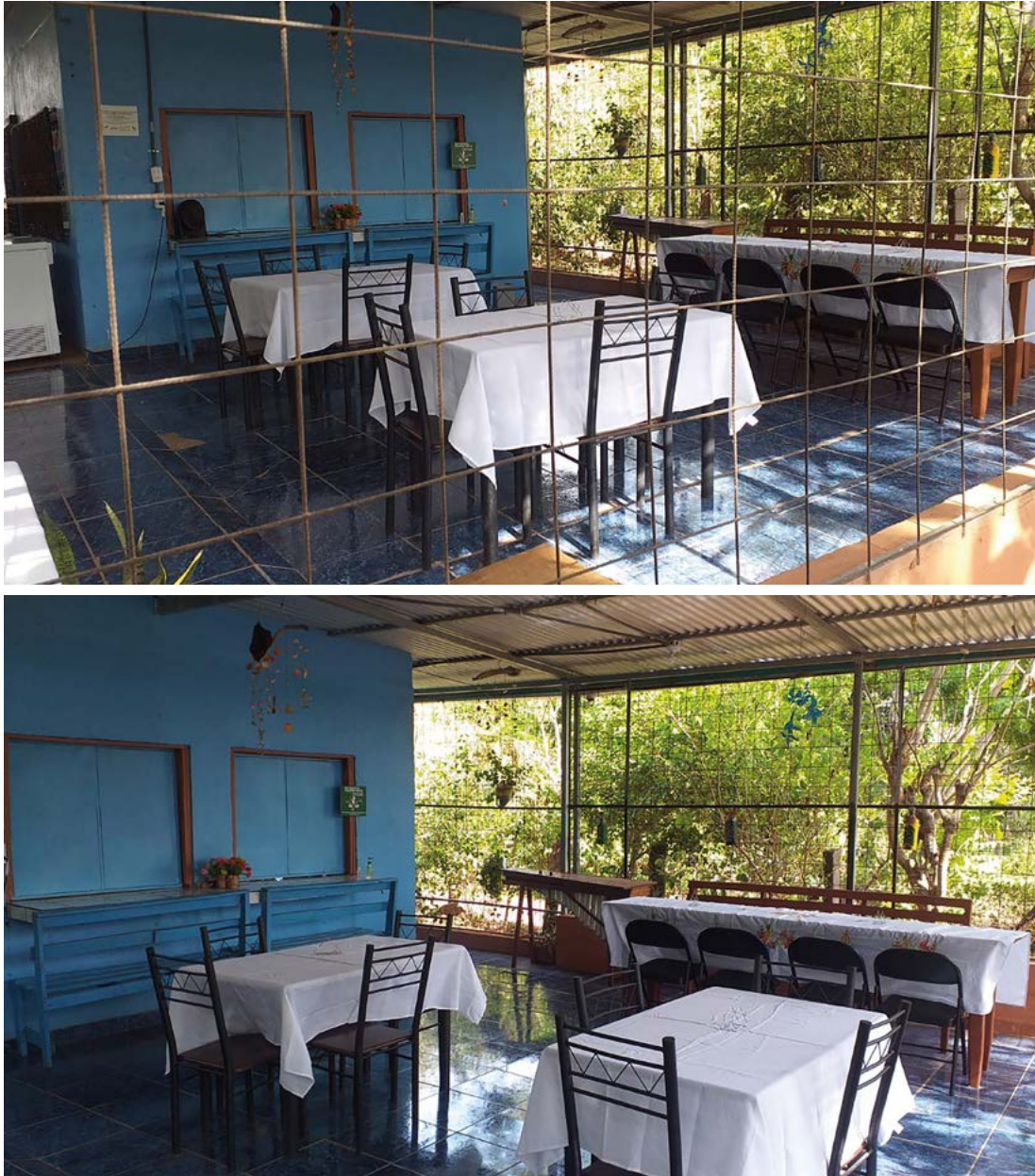
Figura A1. Parte de las mejoras realizadas a las instalaciones de la soda del proyecto Mariposas del Golfo