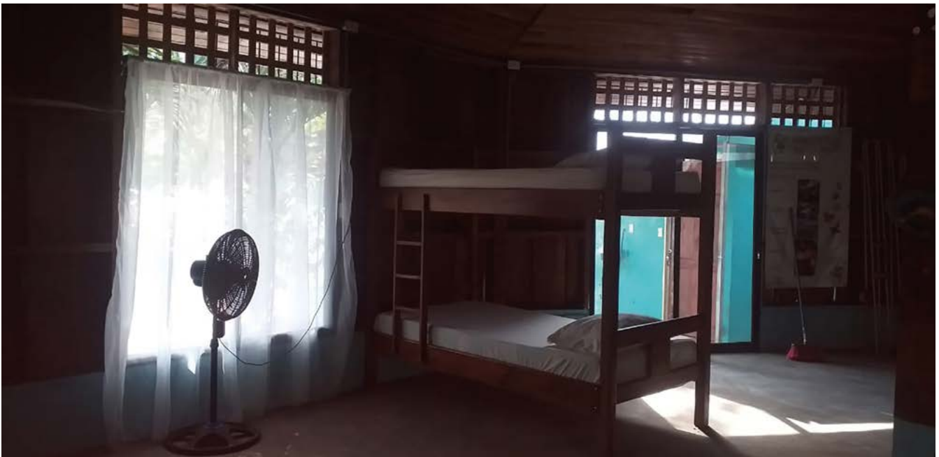
Figura A2. Mejoras y equipamiento de las habitaciones del proyecto Mariposas del Golfo