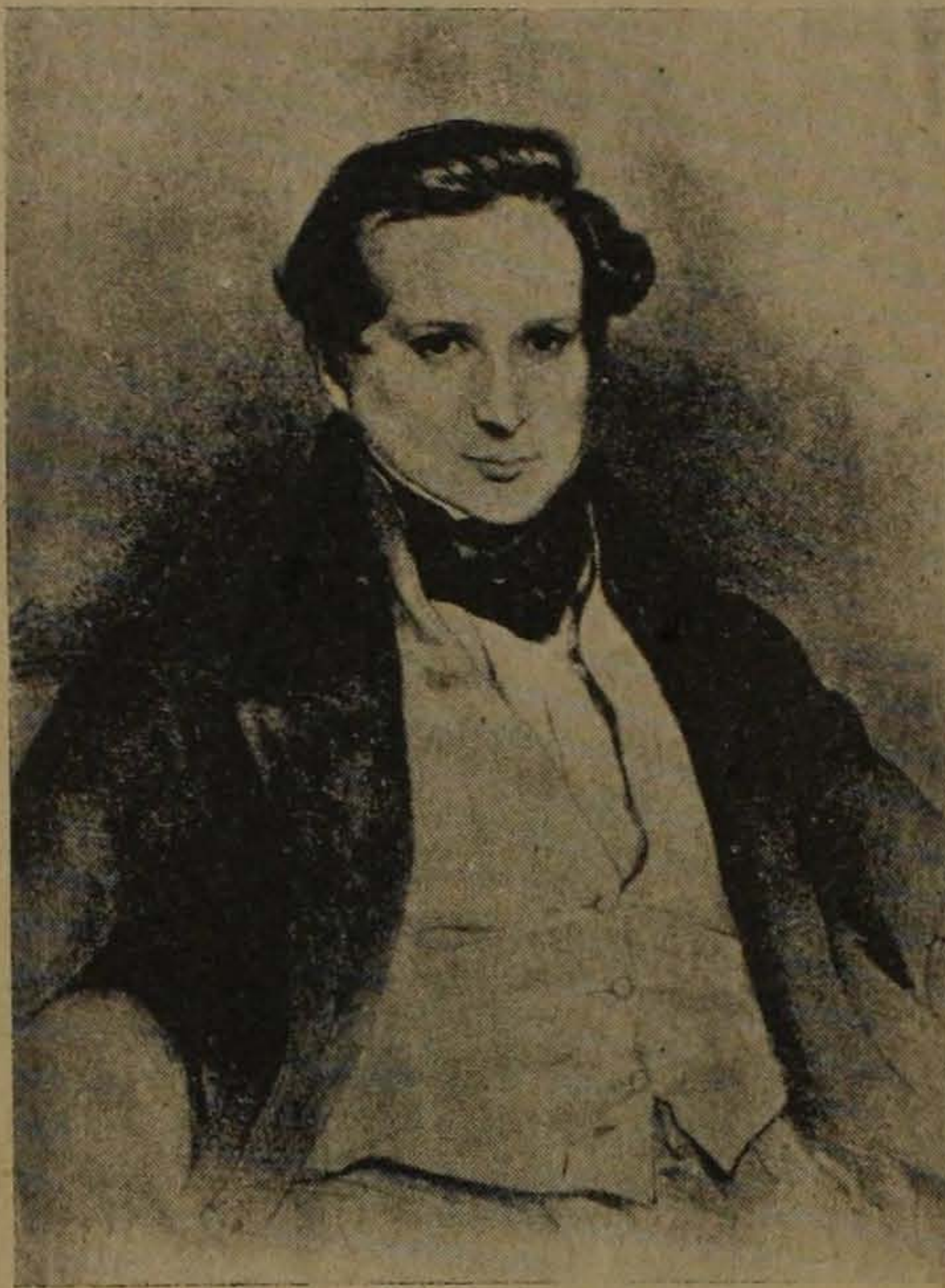
Víctor Hugo en 1829

de buzo de almas. Todo lo comprendió, todo lo supo, todo lo adivinó: el arte de amar, de Ovidio; las primeras decepciones íntimas de la esposa y la manera cauta de despertar su piedad antes de clavarla mañosamente los siete puñales del amor. La primera vez, según cuentan, Sainte-Beuve dió cita a Adela en un cementerio. Era la moda entonces. Además, los cementerios no son en París, como en otras partes, un lugar extramuros con su alameda de canos cipreses que puede recorrer el príncipe Hamlet llevando un cráneo en la diestra. No, son jardines un poco tristes. Por sus senderos mullidos de hojas secas pasa el dolor verdadero como también la viuda fingida y elegantísima, dispuesta a consolar a los solitarios. «No vale la pena de haber leído tantos libros a siete francos cincuenta—escribió una vez irónicamente Maurice Barrés—para amar como todo el mundo». Aludía a los libros de la Biblioteca Alcan, devorados en su juventud estudiosa y ávida. Sainte-Beuve aprovechó asimismo en el cementerio sus lecturas de la Biblioteca Nacional. ¿Obtuvo éxito? En todo caso, lo cantó en versos mediocres y la reprobación de los hombres discretos lo persigue en la tumba.