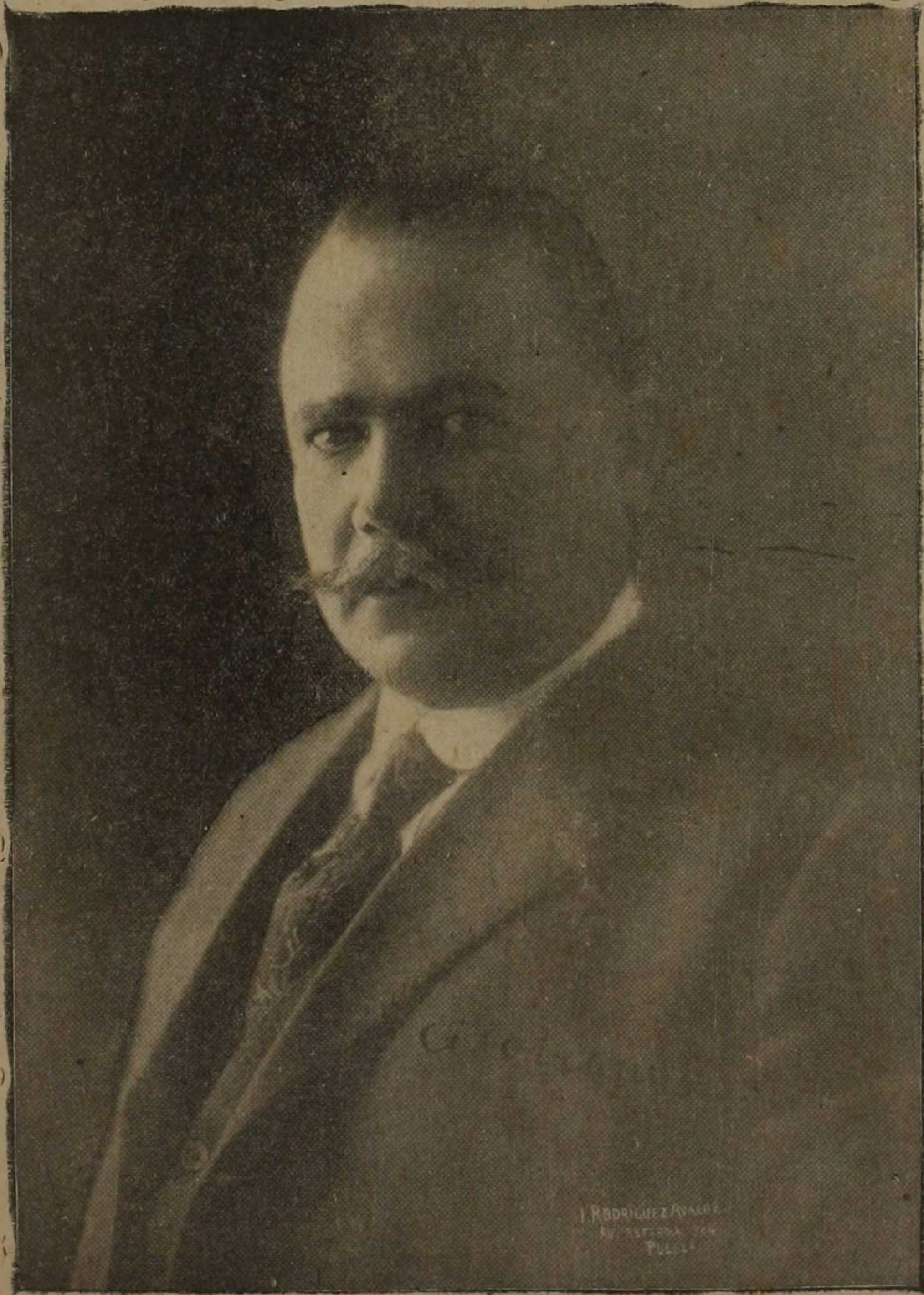
ALVARO OBREGON Presidente de México