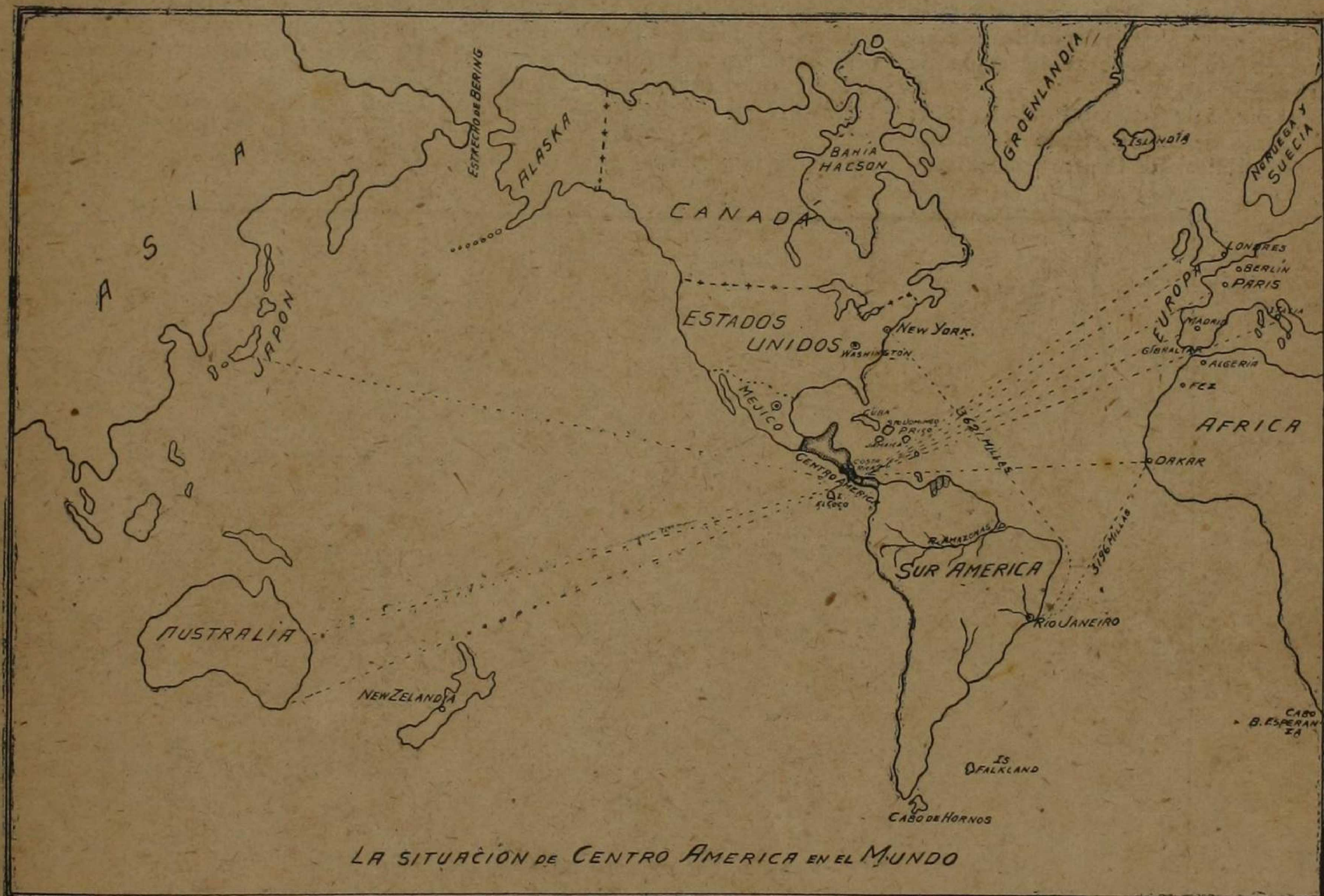
LA SITUACIÓN DE CENTRO AMÉRICA EN EL MUNDO