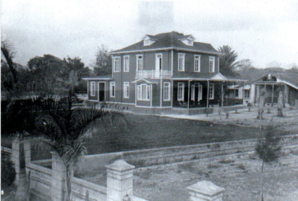
Figura 4. Casa principal de la finca La Caja. 1912.

Al crearse esta Junta, quedaron sin efecto los convenios firmados entre la Oficina de Coordinación y algunas firmas alemanas, al poner del Gobierno de los Estados Unidos por finalizado ese entendimiento y declarar Costa Rica la guerra a los países del Eje. Así, a partir de marzo de 1942, la Junta de Custodia, asumió las anteriores funciones de la Oficina de Coordinación y pasó a controlar las empresas y bienes de los ciudadanos de países enemigos 24 .