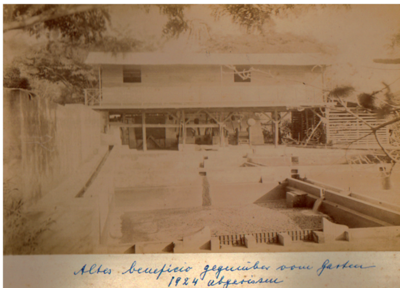
Figura 3. Beneficio antiguo de finca La Caja, visto desde el jardín de la casa principal. Fue deshecho en 1924.

realizada por los señores Hübbe y Peters dio, pues, el magnífico resultado de que surgiera a la vida de la agricultura nacional esta hermosa finca que tiene el privilegio, entre muchos otros de estar distante de la capital sólo a unos diez minutos en automóvil, llegándose a ella por amplia y maciza carretera asfaltada, hasta La Uruca y de ahí a la finca que se extiende de uno y otro lado de camino a la Electriona, siendo este trecho uno de los más pintorescos recodos de las cercanías de San José...( La Tribuna . 1933:18).