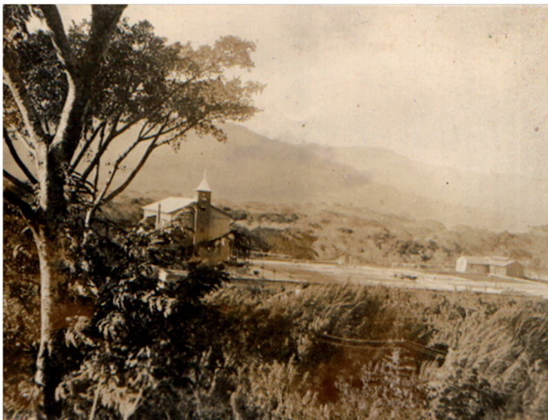
Figura 5. Vista del nuevo beneficio de la finca La Caja, construido después de 1924.

Tenemos que en el Año Fiscal 1941-42, “La Caja” produjo de utilidad neta la suma de \text{¢}77.291.97 , lo que representa el 6% de interés, que en agricultura mayor es lo normal, un capital de \text{¢}1.288.199.50 ; y en el Año Fiscal 1942-43 produjo la suma líquida de \text{¢} 83.495.78 que al 6% representa un capital de \text{¢} 1.391.596,33 (Archivo Nacional de Costa Rica. Serie Junta de Custodia. Documento 67) 28 .