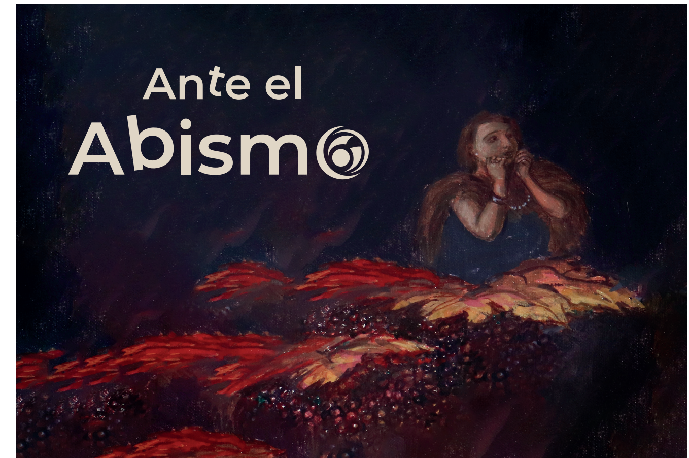
Edición de detalle del "El Gran Teatro del Mundo" de Julio Escámez