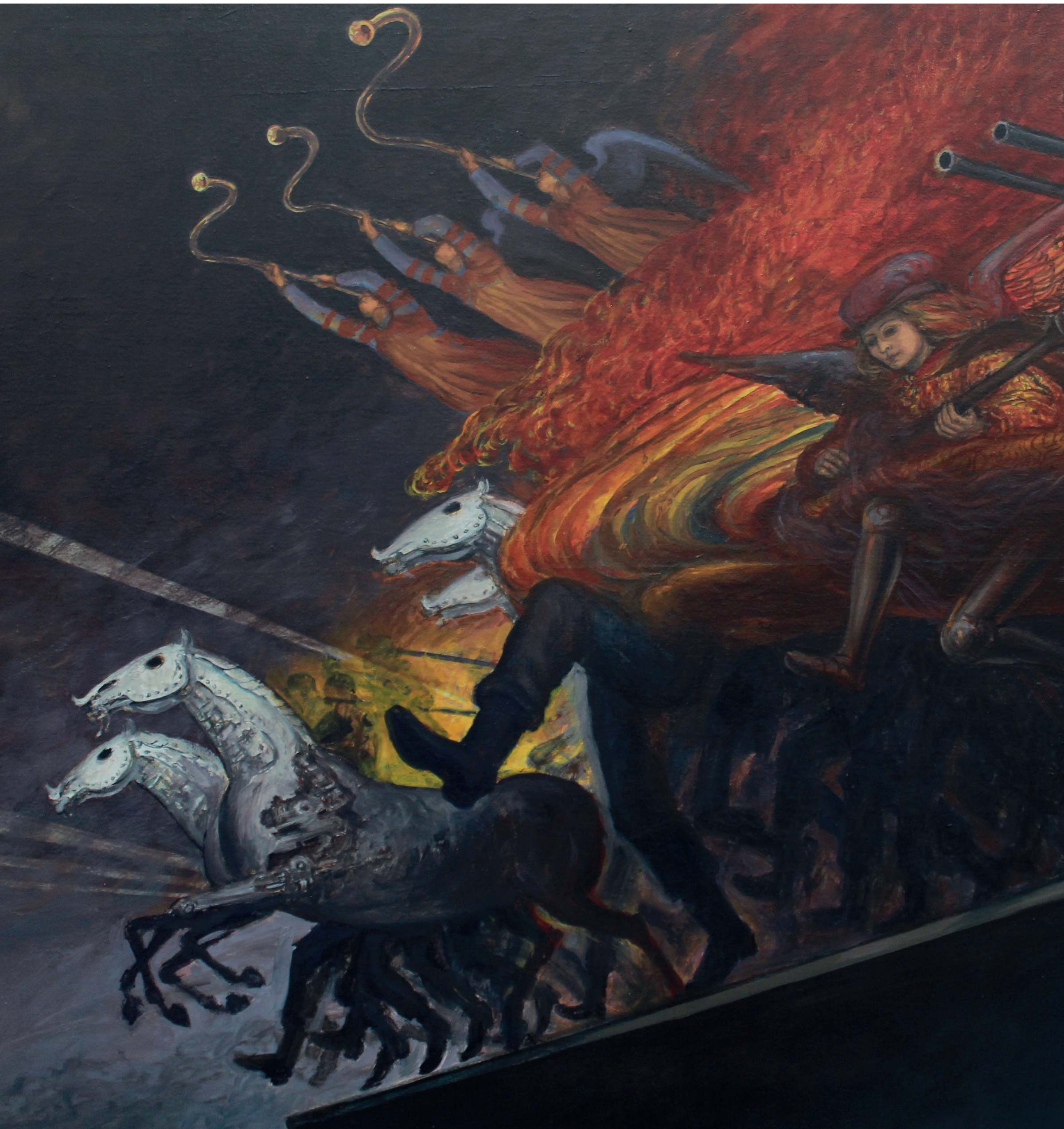
Detalle de "Apocalipsis" obra de Julio Escámez