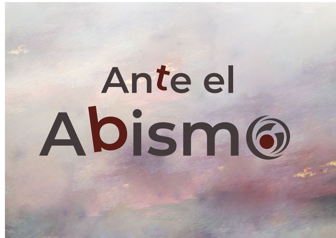
Edición de detalle del "El Vendaval de la Historia" de Julio Escámez