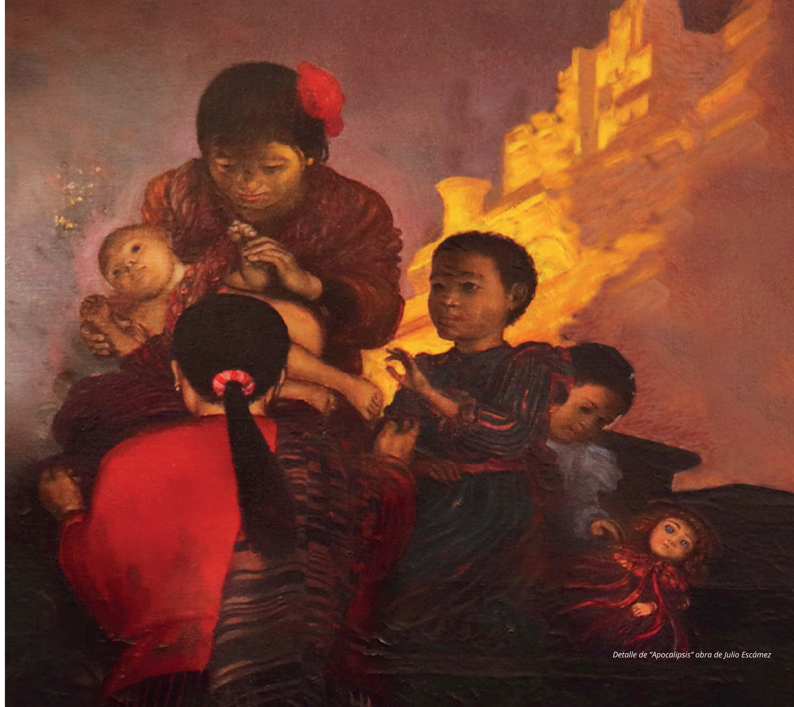
Detalle de "Apocalipsis" obra de Julio Escámez