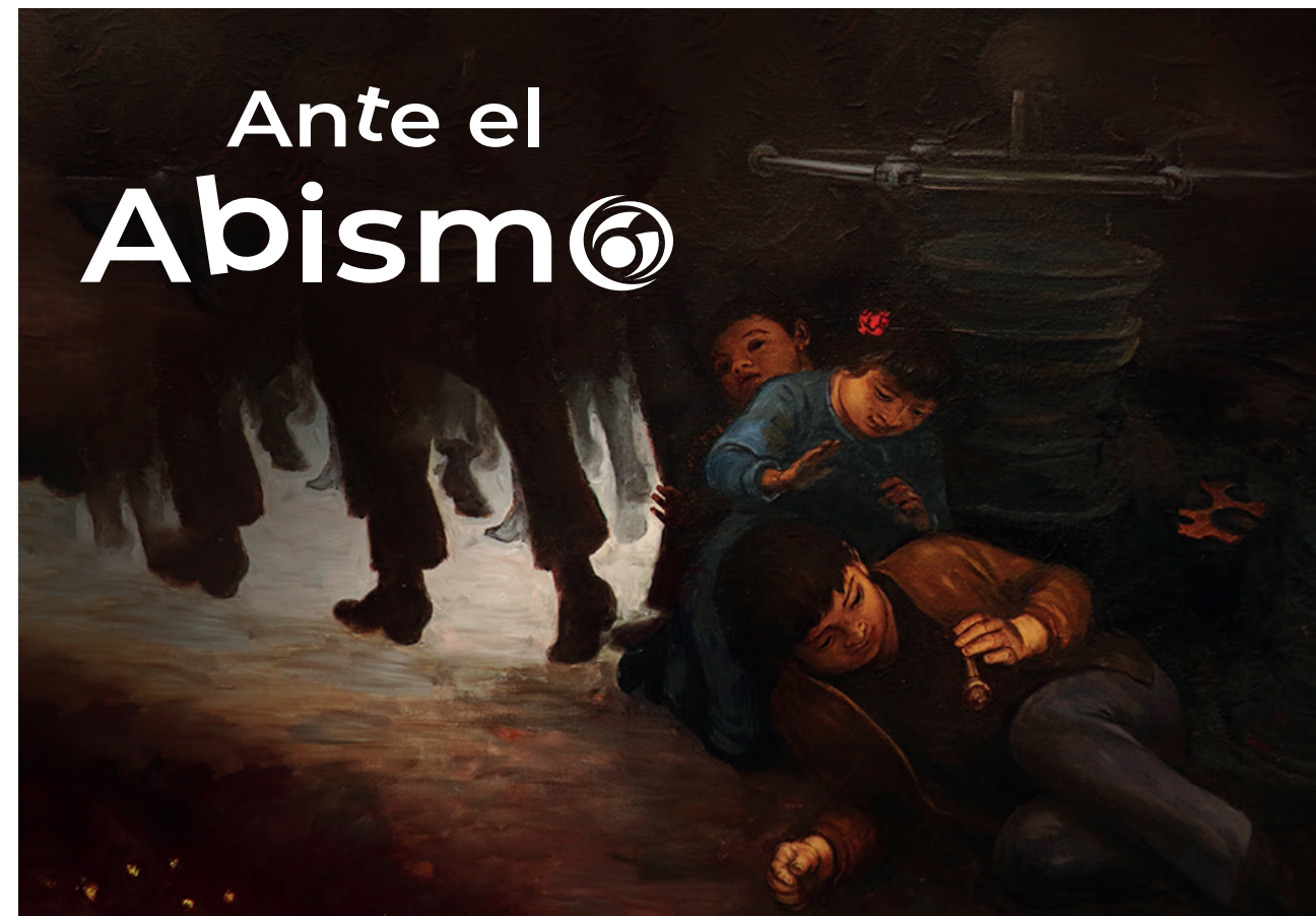
Edición de detalle del "El Gran Teatro del Mundo" de Julio Escámez

Para su uso en fotografías se recomienda su empleo en espacios con una menor saturación de información, evitando el ruido visual y sobreponer la imagen, con la finalidad de no afectar su legibilidad