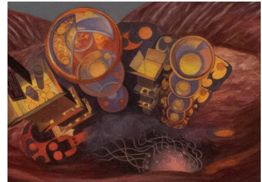
Detalle de imagen del "Vendaval de la Historia" de Julio Escámez

Fue desarrollado bajo los conceptos de Flotar, dinamismo y geometría. Asimismo, se usó como referente un detalle de la obra "El Vendaval de la Historia"