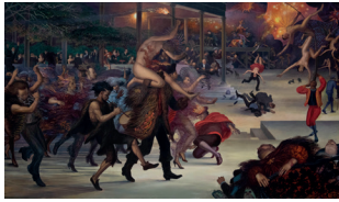
Año: SF Técnica: Mixta sobre tela Dimensiones: 200 cm x 344.5 cm. Temática: Composición con figura, Alegoría.

Es una obra que evidencia el inicio del desastre a partir del enmascaramiento y la indiferencia, en donde se detallan las disputas o conflictos de la burguesía y la gente común. Los detalles de la obra pueden ser vistos a lo largo del recorrido entre el "Túnel de la Indiferencia" y "El Espectáculo de la vida".