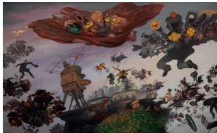
Año: SF Técnica: Pintura, Mixta (Témpera y óleo) Dimensiones: 187 cm x 338.5 cm. Temática: Composición con figuras, alegoría.

La obra nos muestra las luchas y la crisis del hombre moderno ante los conflictos de la humanidad, nos hace replantearnos el devenir de la historia, nos hace pensar que estamos rodeados de injusticias, desigualdades y abusos de poder. Detalles de la obra pueden ser observados en el "Abismo" y en la sala del "VendaVal de Cambios".