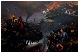
Año: 2000 Técnica: Mixta sobre tela. Dimensiones: 241.5 cm x 367 cm. Temática: Composición con figura, Alegoría.

La obra es un presagio del devenir de la humanidad a través de escenas que aluden una realidad delimitada por el abismo que separa a estos dos mundos nacidos de la indiferencia. Sus detalles pueden ser observados en "Migración" y en "El Desvelo del Presente".