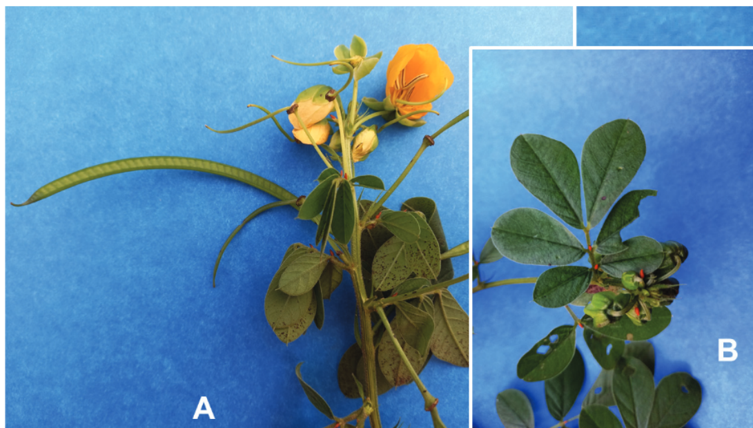
Figura 1. Planta Senna cobanensis . A: Detalle de la inflorescencia en racimos axilares con corolas zigomórficas amarillas y los frutos una vaina verde, comprimida, cuadrangular y curvada. B: Hojas compuestas, paripinnadas con tres pares de foliolos y estípulas interpeciolares lineares anaranjadas.

Los metabolitos secundarios de las plantas son derivados de metabolitos primarios y no tienen un papel especial en su homeostasis (Ávalos García & Pérez-Urria, 2009; Díaz González, 2010; Reyes-Silva et al., 2020), pero forman parte de su respuesta adaptativa de defensa ante factores estresantes bióticos y abióticos como herbivoría, ataque de insectos o patógenos, sequía, salinidad y presencia de metales pesados (Ahanger et al., 2020; Díaz González, 2010; Reyes-Silva et al., 2020). La toxicidad de los metabolitos secundarios puede afectar a mamíferos herbívoros, aunque no todos tienen la misma susceptibilidad debido a diferencias toxicocinéticas interespecies (Díaz González, 2010). En el género Senna se han encontrado diversos fitoquímicos incluyendo alcaloides de piperidina, terpenoides, glucósidos, saponinas, antraquinonas y esteroides (Oladeji et al., 2021; Regalado-Olivari, 2009; Reyes-Silva et al. 2020).