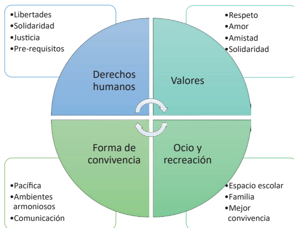
Figura 1. Representaciones sociales de la paz de jóvenes escolarizados