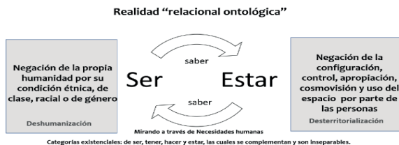
Figura 1. Esquema de la Colonialidad del Estar