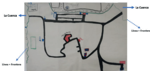
Figura 3. Mapa de la comunidad de la Milpa, 2022

Nota. Elaboración colaborativa de jóvenes migrantes mediante cartografía participativa, junio 2022.