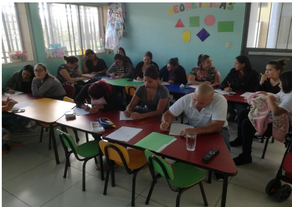
Cecudi Taras: Sesión 3. Actividad: Mi biografía . Elaboración de un escrito individual, que incluya algunos aspectos de su historia de vida