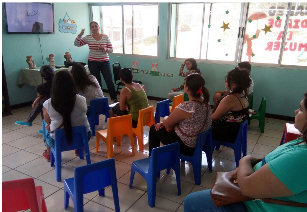
CECUDI Taras. Sesión 15. Charla magistral Análisis de elementos teóricos de la comunicación asertiva.