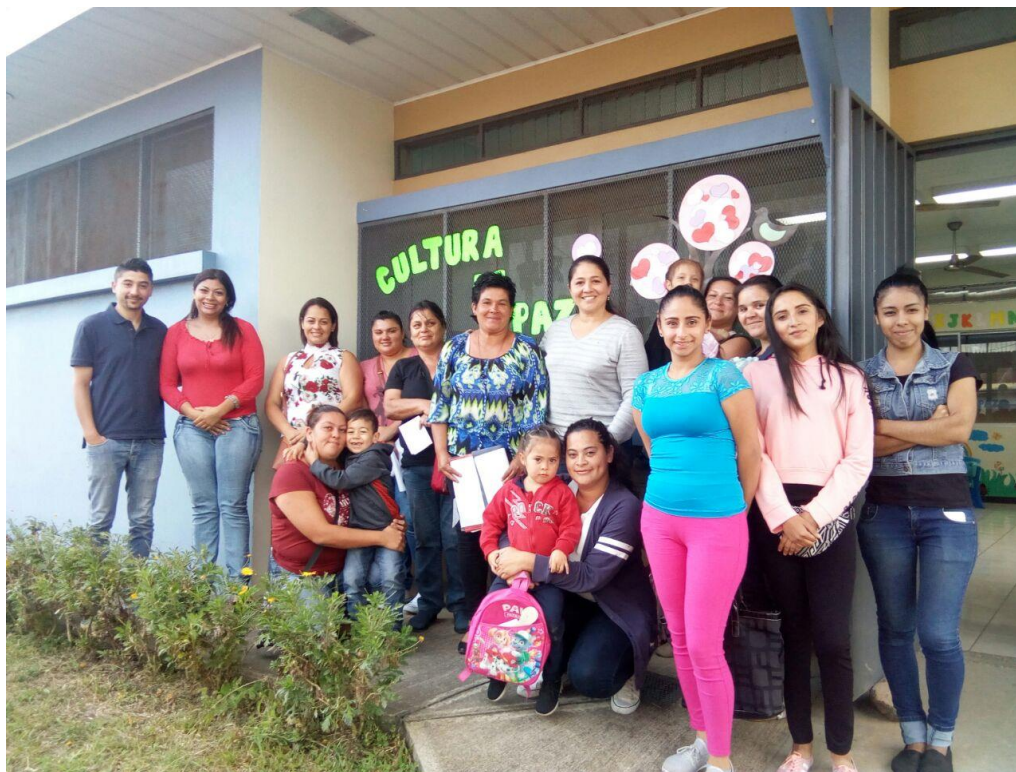
Participantes del CECUDI Manuel de Jesús.