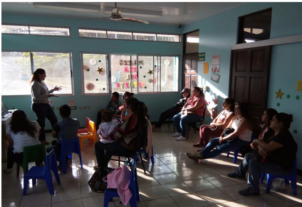
CECUDI Taras. Sesión 17. Actividad Charla magistral . Conceptos y elementos teóricos relacionados con el enojo y la comunicación