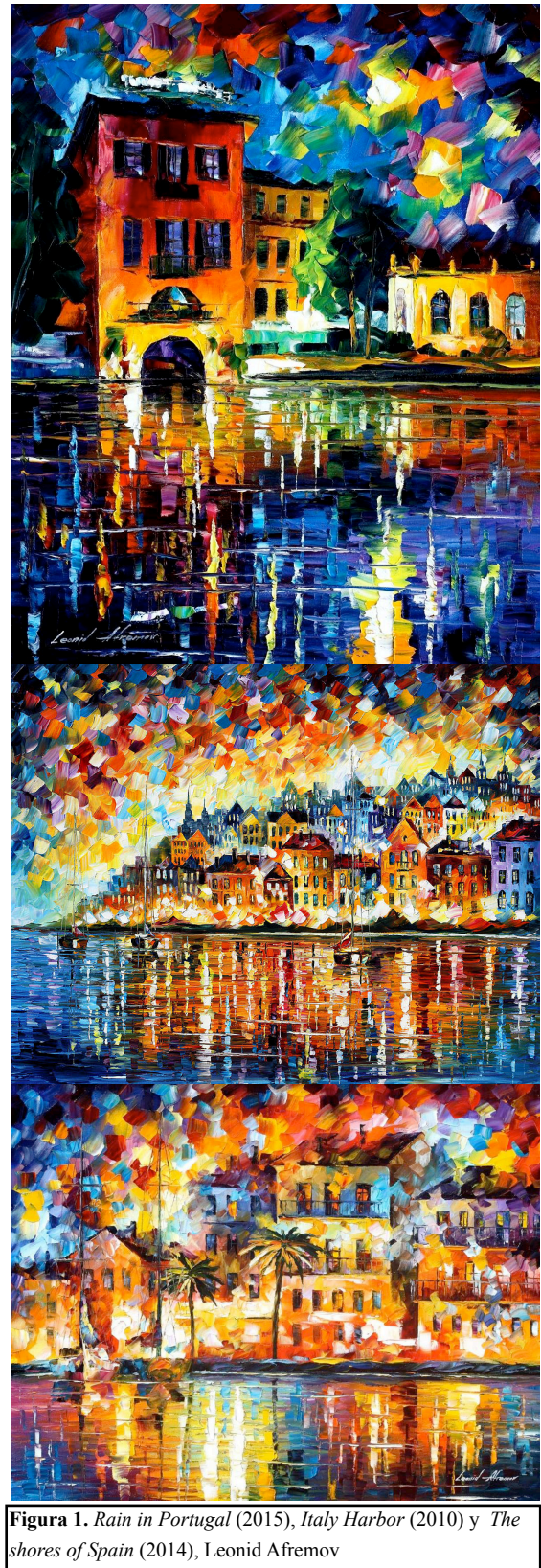
Figura 1. Rain in Portugal (2015), Italy Harbor (2010) y The shores of Spain (2014), Leonid Afremov