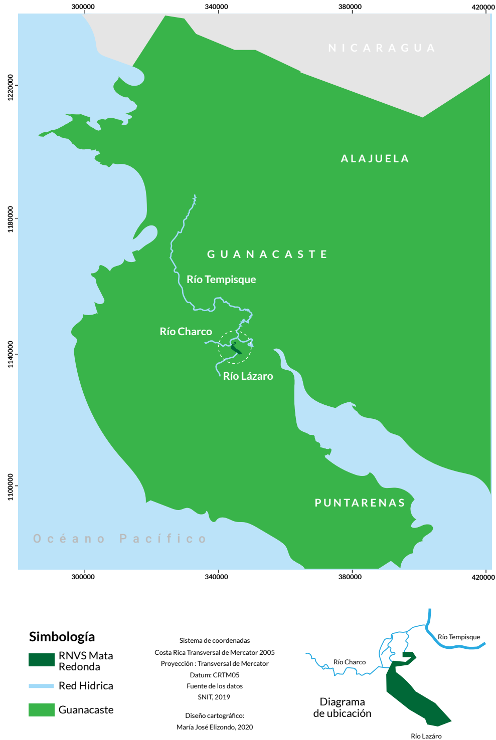
Figura 1. Humedales de la Cuenca Baja del Río Tempisque

Nota: Elaboración María José Elizondo (2020).