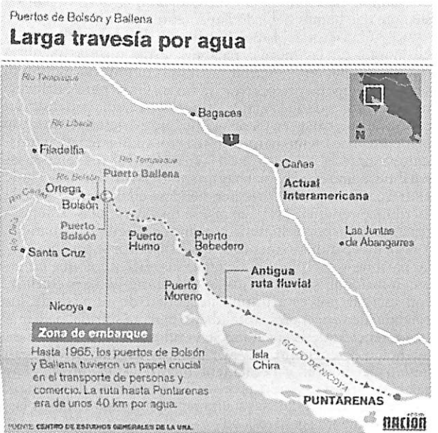
Mapa N° 1 Ubicación de los puertos Ballena y Bolsón, ruta histórica Ejército 1856-1857 y humedal

Fuente: Publicado en La Nación , domingo 30 de julio, 2006.