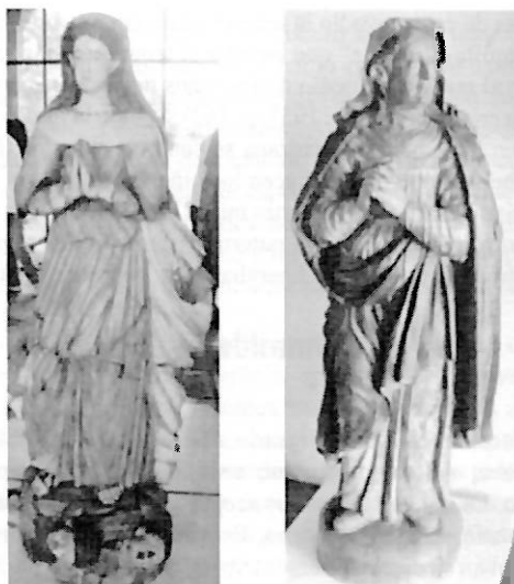
Figura 3. Imágenes femeninas. Museo de San Miguel de las Misiones.

educaba hacia la vida virginal, sino que además construía identidades adscritas a un modo de vida determinado (Entwistle, 2002). Aparentemente se trata de prácticas que terminaron siendo naturalizadas por las mujeres, puesto que- según nos dice el misionero- ellas le agradecían por enseñarles el valor de la vida civilizada. Entiéndase “vida civilizada” como la rutina devocional del día a día (Figura 3).