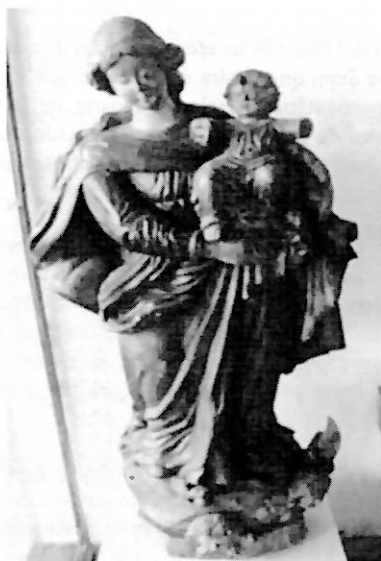
Figura 4. Nuestra Señora Madre de Dios. Museo de San Juan de las Misiones.