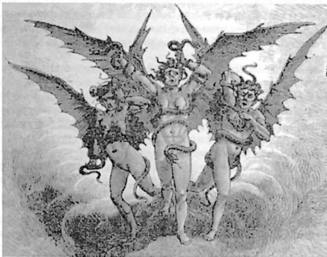
Figura 2. Representación de las Furias o Euménides de la mitología greco-romana.