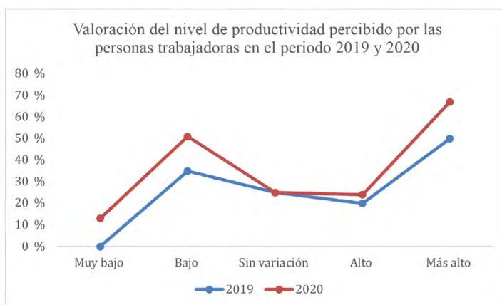
Figura 2: Valoración de productividad por parte de la persona trabajadora

Las personas participantes en el estudio, coinciden, en ambos periodos, en que su nivel de productividad es mayor en la modalidad de trabajo a distancia, esto se puede comparar con los resultados de las desventajas del teletrabajo que indican que existe una tendencia a trabajar más horas de la jornada establecida, lo que en consecuencia puede inducir este aumento en la productividad. No obstante, esto también tiene consecuencias en la calidad de vida de las personas puesto que se afectan otras áreas de bienestar, como el tiempo social y emocional.