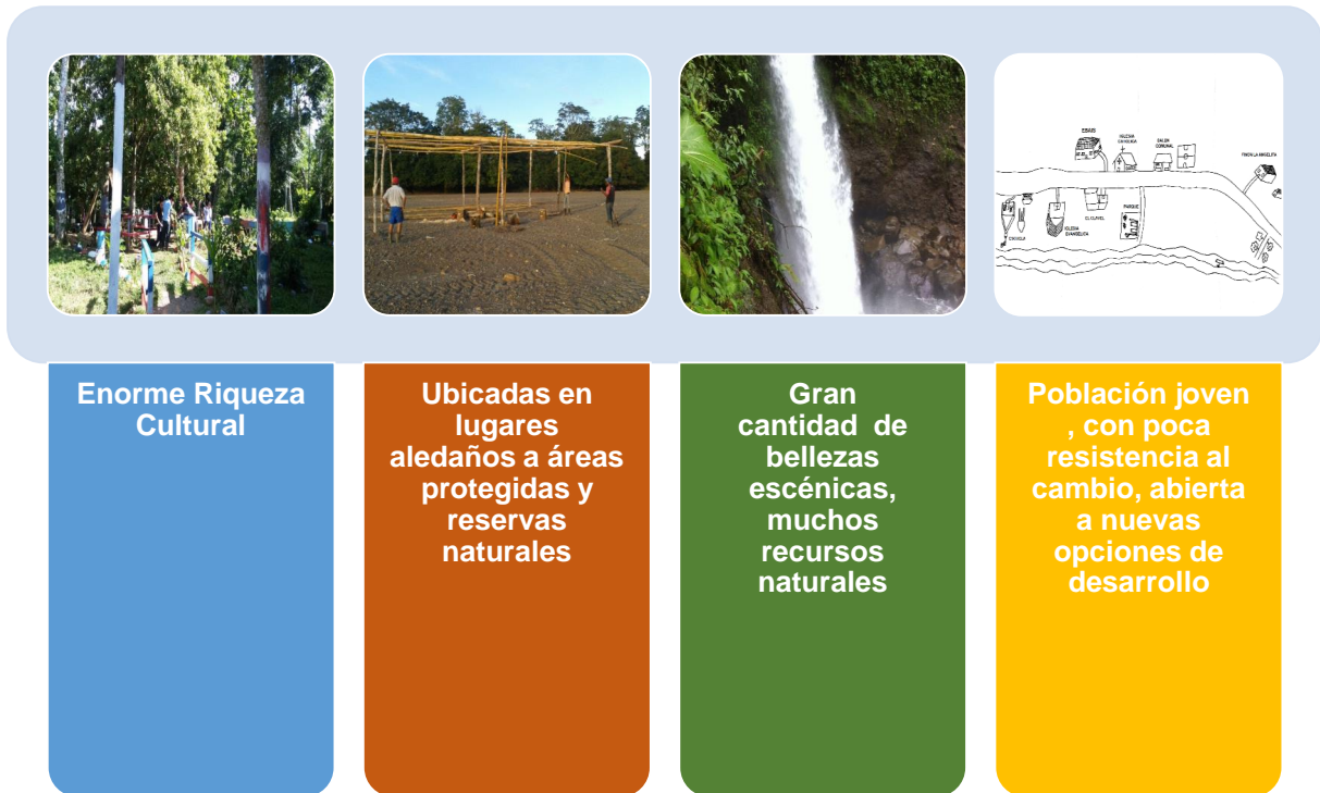
Figura 3. Potencialidades de las comunidades.