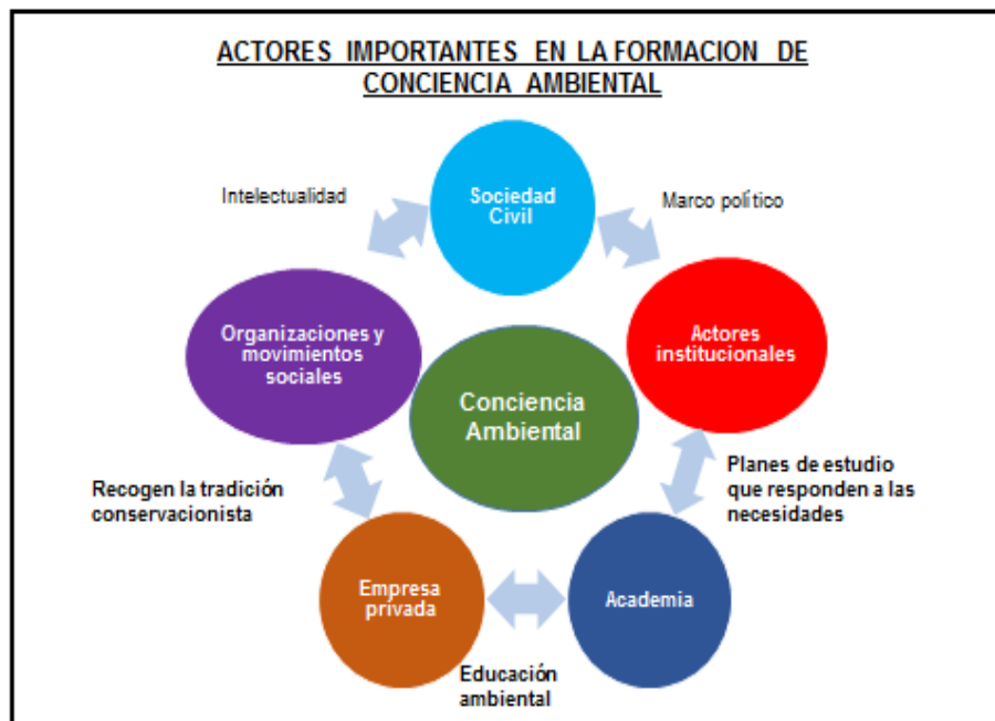
Figura 4. Actores de la conciencia ambiental en Costa Rica