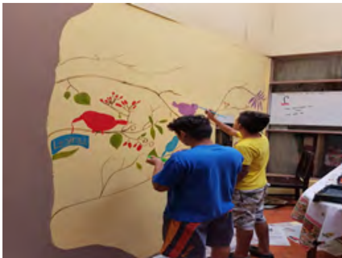
Figura 1. Estudiantes pintando un mural en el albergue

Nota: Elaboración propia de las autoras.