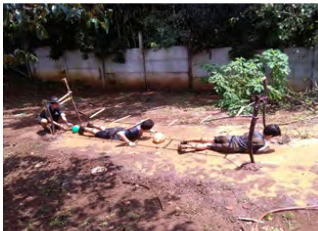
Figura 2. Estudiantes realizando actividades físicas en el patio para estimular destrezas motoras

intencionalidad pedagógica al potenciar valores y destrezas personales como la comunicación asertiva entre el estudiantado.