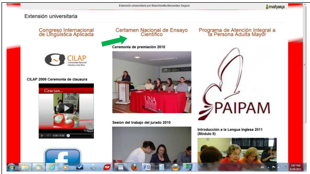
FIGURA 6: Registro del apartado Extensión Universitaria