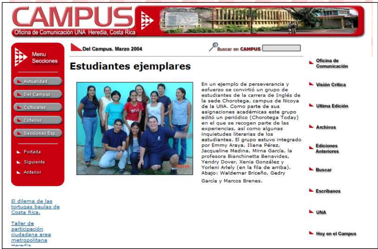
FIGURA 3: Enlace de la sección Docencia Universitaria del sitio web académico en estudio con el número del periódico Campus Digital de marzo del 2004