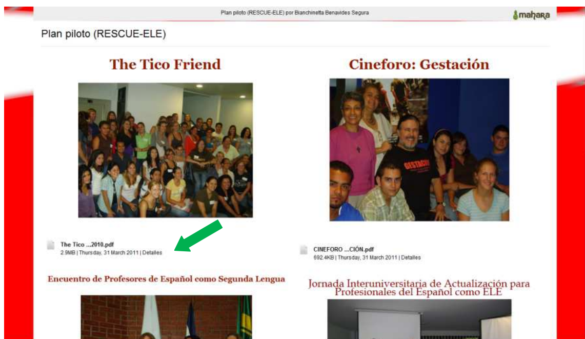
FIGURA 4: Registro gráfico del Plan Piloto del proyecto RESCUE-ELE

Uno de los objetivos del proyecto Rescue-ele, documentado ampliamente en el sitio web en cuestión buscaba generar espacios para el contacto intercultural de los estudiantes de español como segunda lengua en la cultura meta. Como se aprecia en la figuras 4 y 5, gracias al registro gráfico correspondiente al taller denominado “The Tico Friend”, localizado en la sección Proyectos de investigación-plan piloto fue posible registrar en forma gráfica varias reacciones de los participantes, las cuales se sistematizaron con el propósito de presentarlas en la conferencia anual de la Asociación Estadounidense de Profesores de Español y Portugués en julio del 2011 y que resultaron una serie de contactos con académicos estadounidenses quienes han realizado actividades similares y que también desean documentar dichas experiencias por medio de registros gráficos en línea.