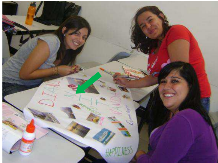
FIGURA 7: Registro gráfico sobre la aplicación de estudios previos en estudiantes de inglés como segunda lengua