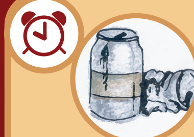
Una lata de aluminio De 200 a 500 años