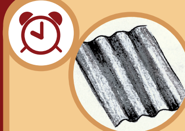
Una lámina de zinc De 10 a 100 años