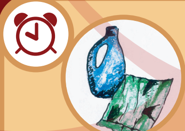
Materiales de plástico (bolsas o botellas) Alrededor de 500 años