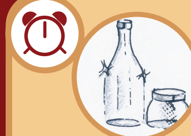
Envases de vidrio Indefinido