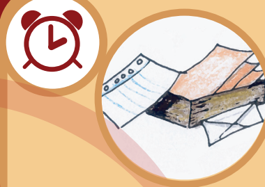
Hojas de papel o un cuaderno De 2 a 4 semanas