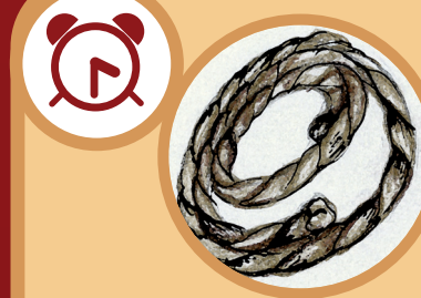
Mecate De 22 días a 14 meses