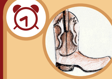
Un zapato de cuero natural De 3 a 5 años