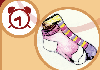
Una media de lana 1 año