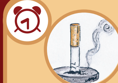
Filtro de cigarro 5 años