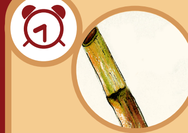
Una estaca de bambú De 1 a 3 años