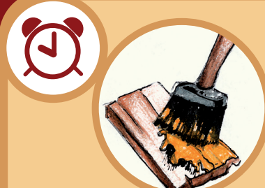
Una estaca de madera pintada 13 años