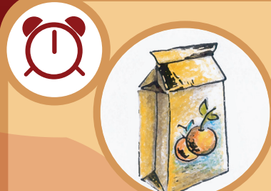
Un empaque tetra brick Indefinido