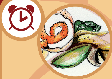
Cáscaras de frutas y verduras De 3 semanas a 1 mes