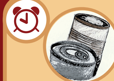
Un envase de lata 100 años