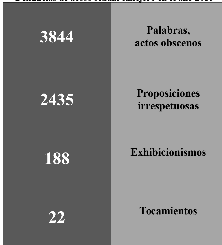
Figura 1 Denuncias de acoso sexual callejero en el año 2016

Fuente: Datos preliminares casos denunciados ante los Juzgados Contravencionales en el año 2016, según la Sección de Estadística del Departamento de Planificación del Poder Judicial de Costa Rica, disponibles en la página web del Observatorio de Violencia de Género contra las Mujeres y Acceso a la Justicia.