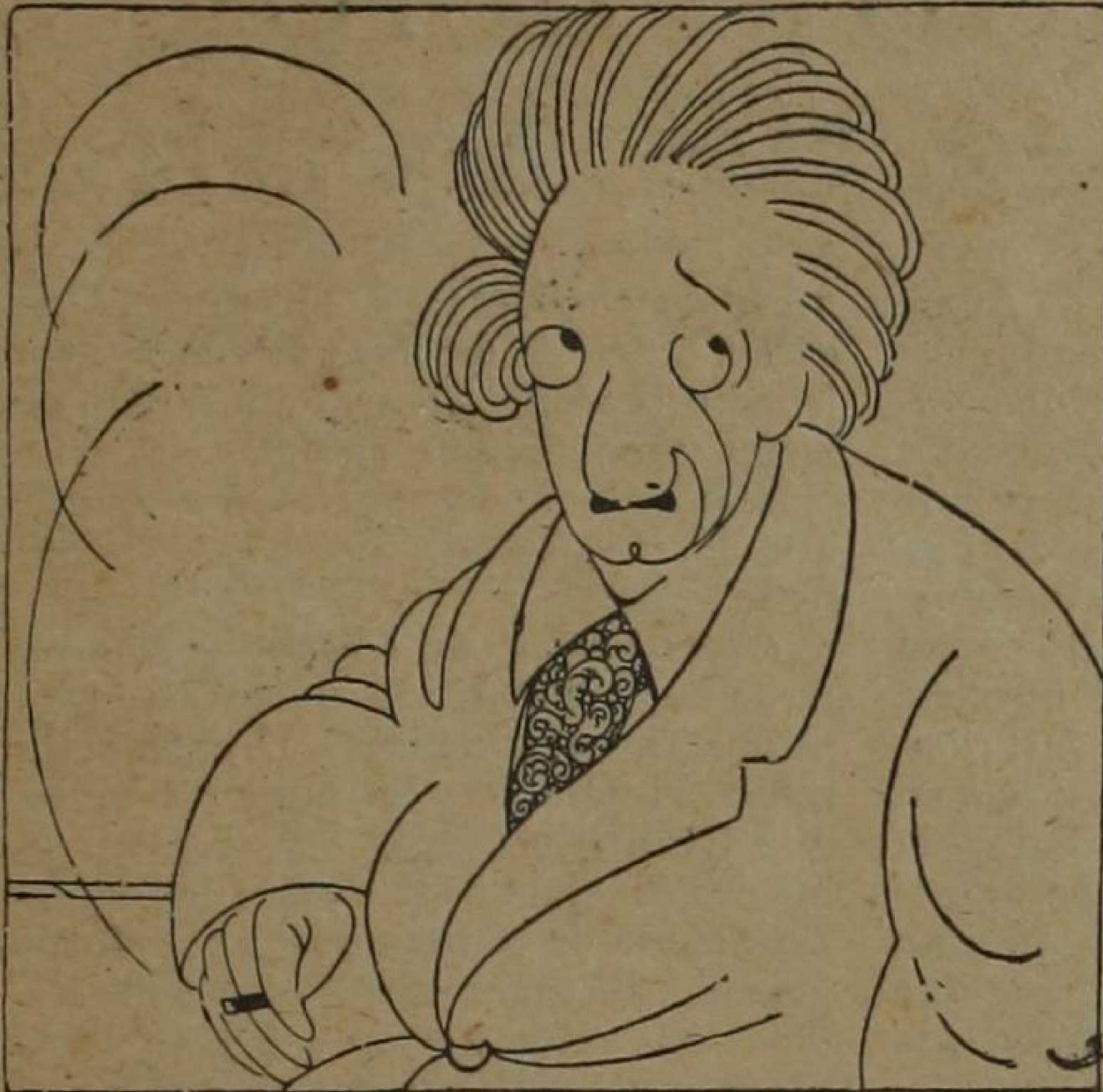
(El Sol, Madrid).

dos, con el abecedario descubierto por otros. Tal es el caso de Newton. Pero los hay que descubren — como Galileo — las letras del abecedario. Einstein es como una mezcla de estos dos caracteres. La civilización occidental — superior a todas, según Ortega — puede considerar sus conquistas en la ciencia física como sus conquistas más plenas. La Física procede de una actitud contemplativa ante el mundo, y acaba en