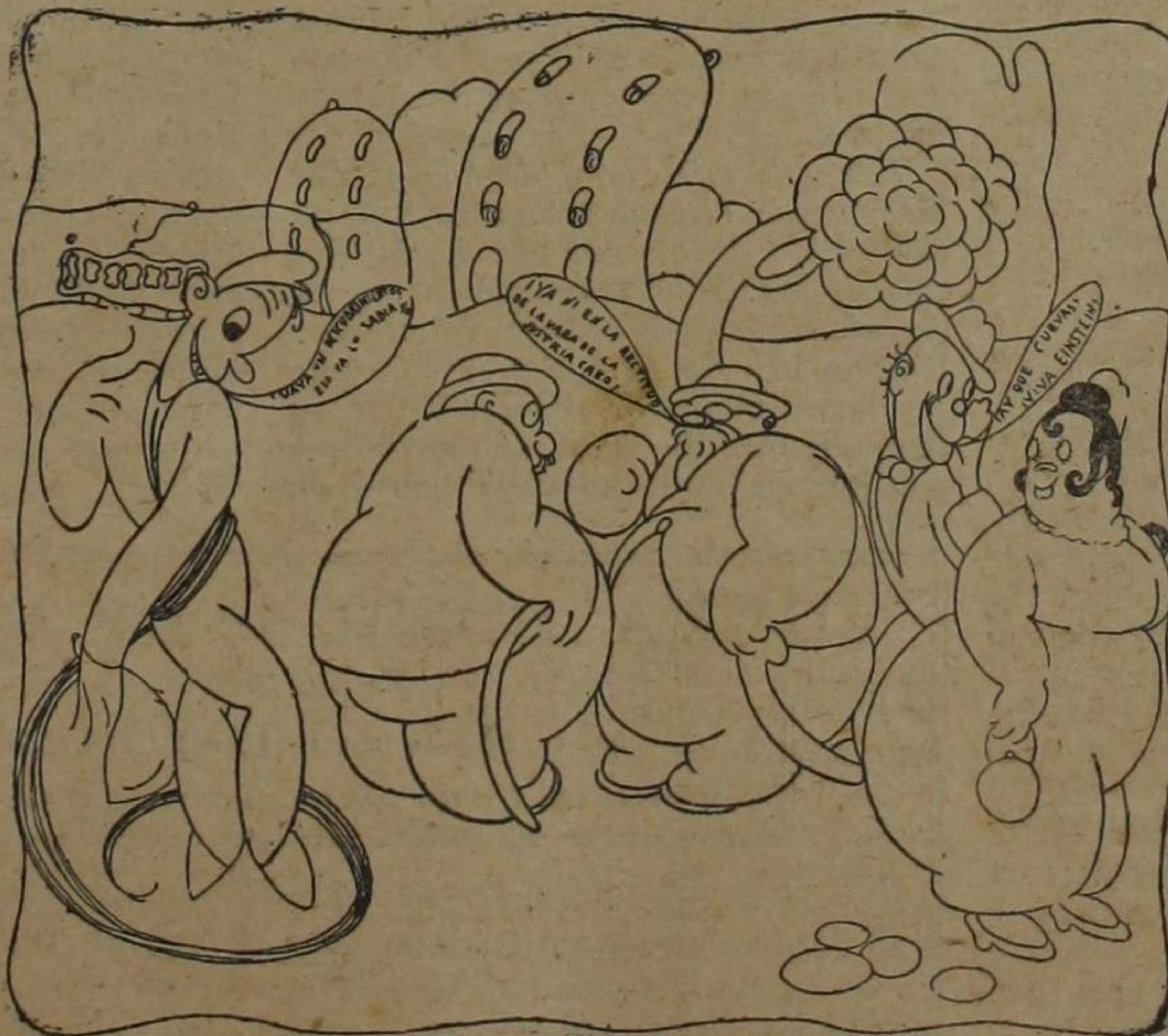
Einstein dice que no existen líneas rectas; todas son curvas