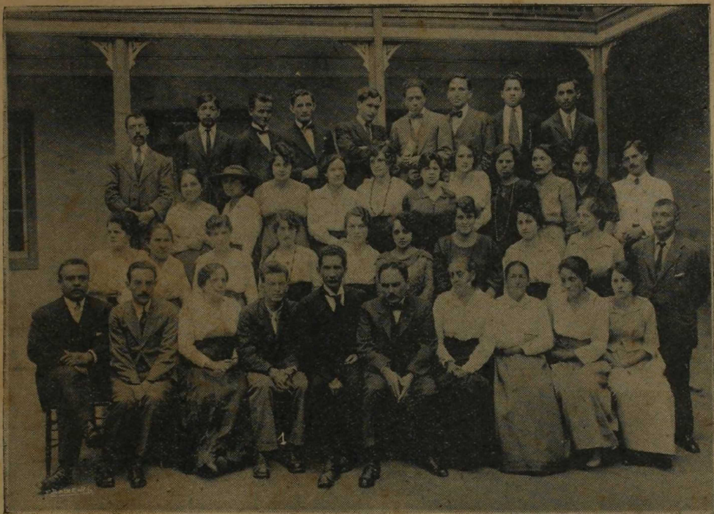
Asistentes al Primer Curso Agrícola de Verano hecho en Costa Rica.—Del 9 al 24 de diciembre de 1919.