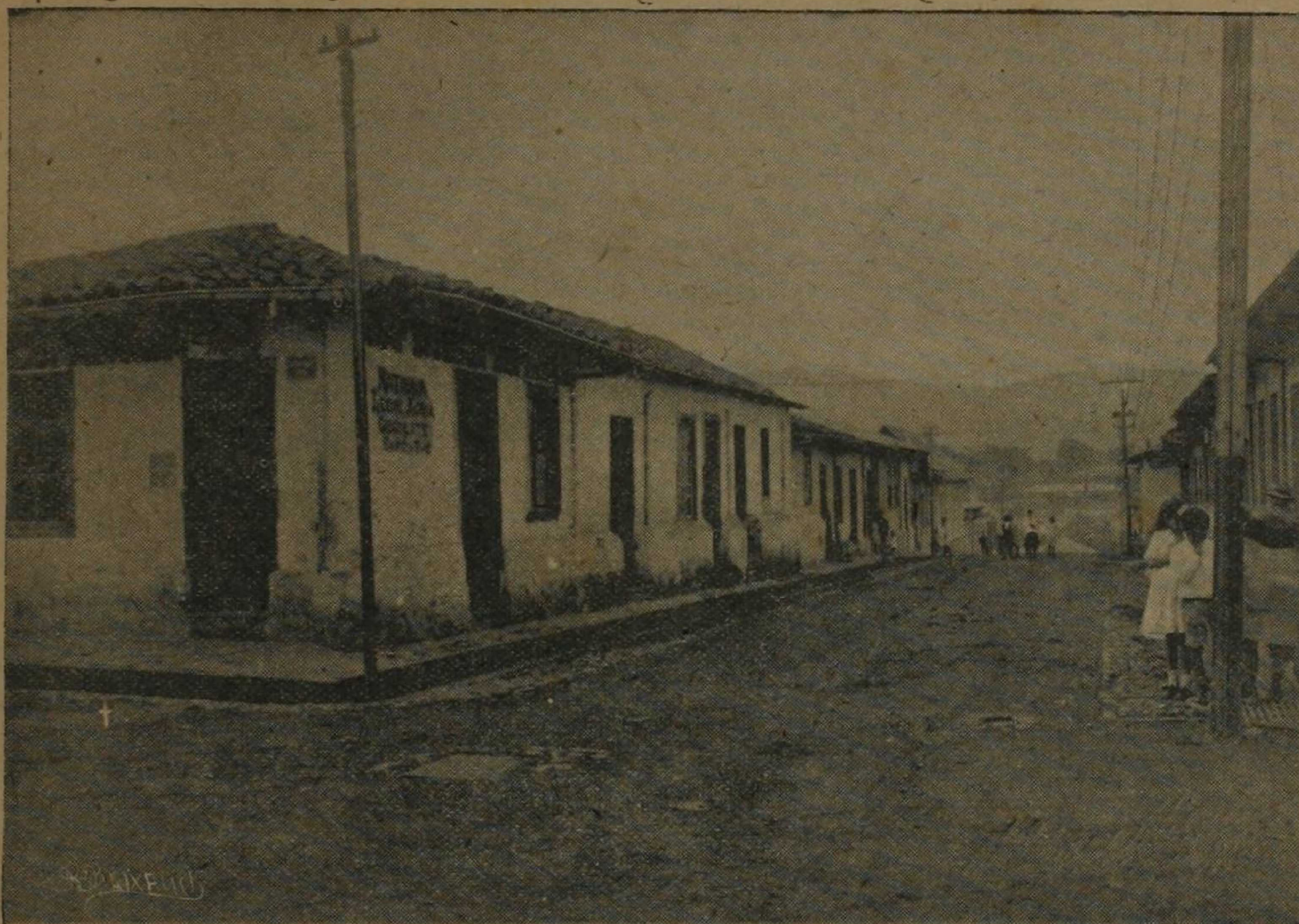
Sitio (+) en que fué ultimado el General J. J. Tinoco, ex-Ministro de la Guerra, la noche del 10 de agosto de 1919.