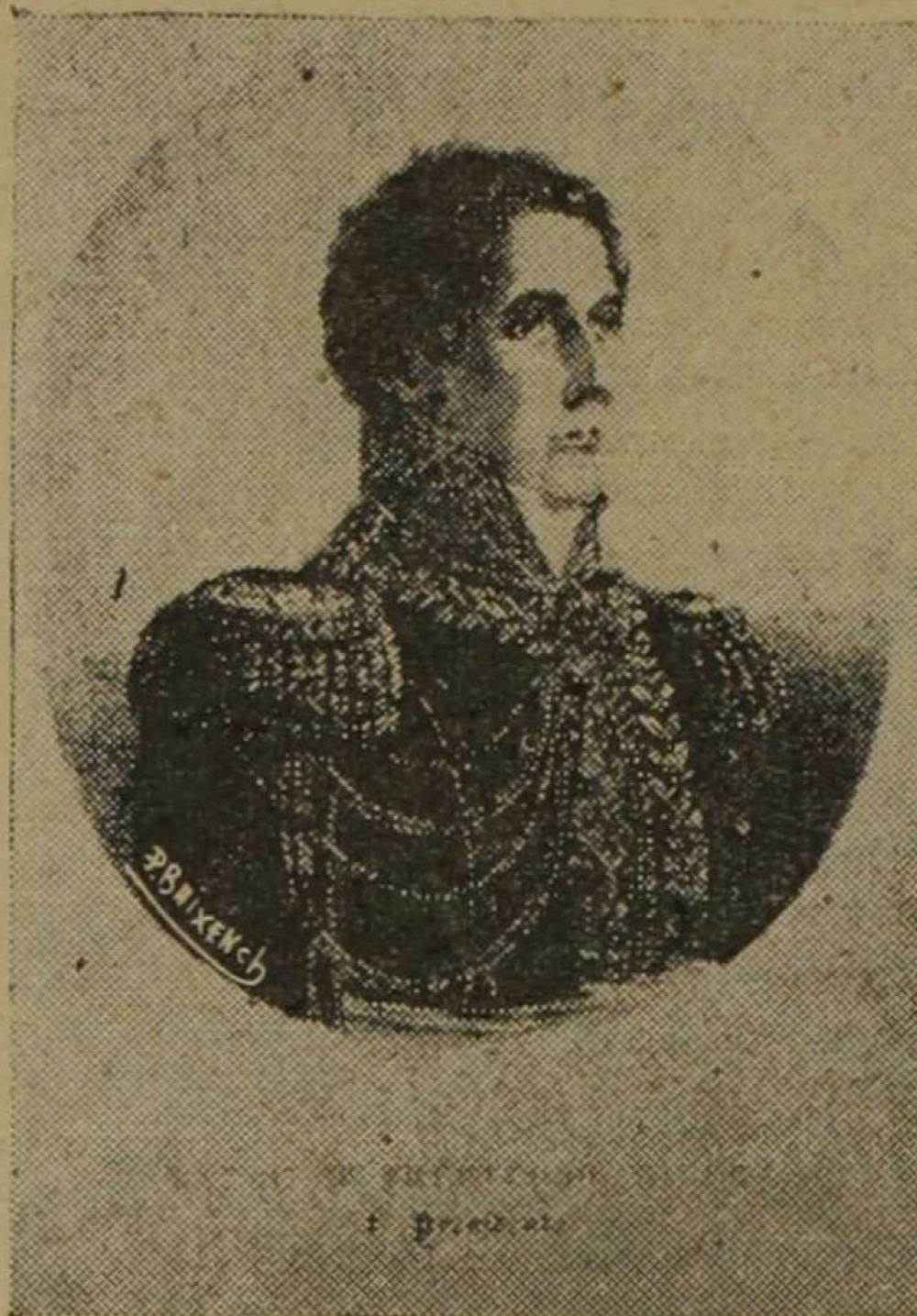
Gral. Fructuoso Rivera, 1er. Presidente del Uruguay.

(Envío del autor, en Montevideo, junio de 1948).