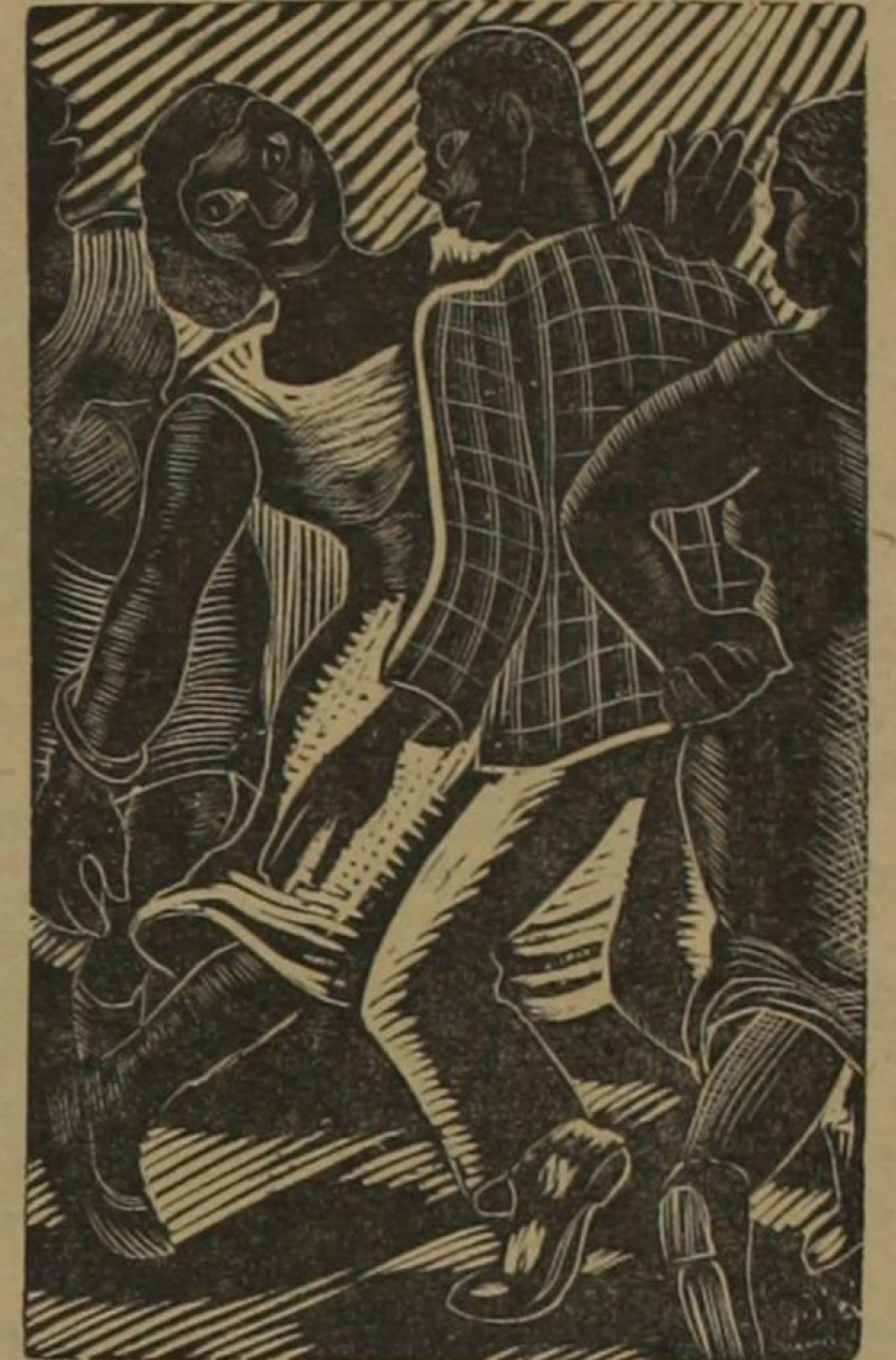
(Madera de Francisco Amighetti)

La vida le debía una muerte buena, una muerte cualquiera, no un hipo de espanto.