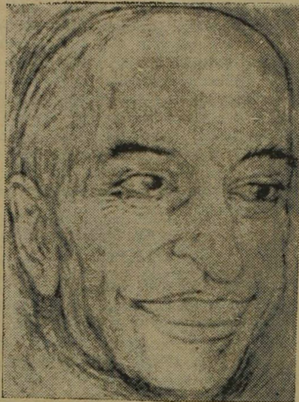
Arnold J. Toynbee

Menos brillante que Spengler, cuya Decadencia de Occidente ha corrido con tanta fortuna antes de la guerra, aunque dotado de un estilo lleno de fluidez y que posee las virtudes del crecimiento interno, Toynbee es mucho más historiador que Spengler, y sabe mucho mejor que él guardar su física de su metafísica. Pues al fin y al cabo esa Ciudad de Dios, a la que se va acercando en sus últimas conferencias de los Estados Unidos y en sus últimas publicaciones para nada afecta la relativa objetividad de sus trabajos, y tiene el valor de un epifonema final o un Laus Deo . (Tampoco puede decirse que perturbe el vigor científico de Werner Jaeger, sumo helenista, cierta atracción agustiniana hacia la interpretación religiosa de la historia, que él sería el primero en confesar y que se irá percibiendo más y más en sus investigaciones de futura publicación). No, Toynbee no aplica, germánicamente, como Spengler, sus moldes teóricos sobre la masa de los hechos humanos, sino que intenta desentrañar los principios en el seno de los he-