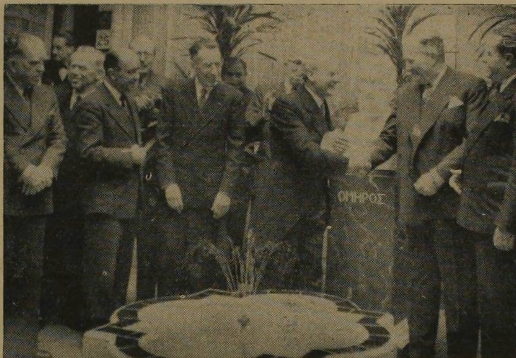
En el Consulado General de Grecia, en Bogotá, el 25 de Marzo de 1941

Señores: Por S. M. el rey Jorge II de Grecia y por el heroico pueblo helénico!"