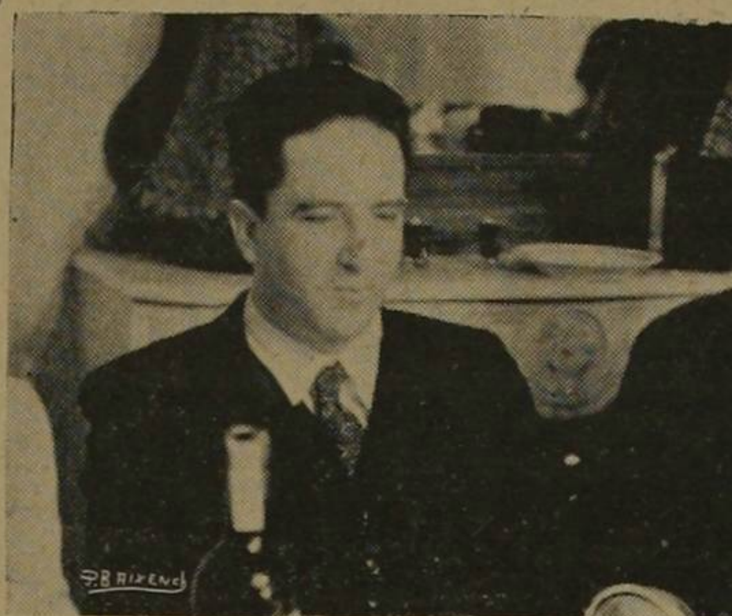
Ciro Alegría (1941)

Los Perros Hambrientos —es otra cosa. No hay que pensar, —digo esto a quienes no han leído la obra— que simboliza otra cosa. No. Son eso mismo, perros hambrientos, elevados a la categoría de personajes de novela. En el mismo escenario, el Perú tan variado y amplio, la sierra peruana, la puna inhóspita, con los mismos hombres identificados con la natura-