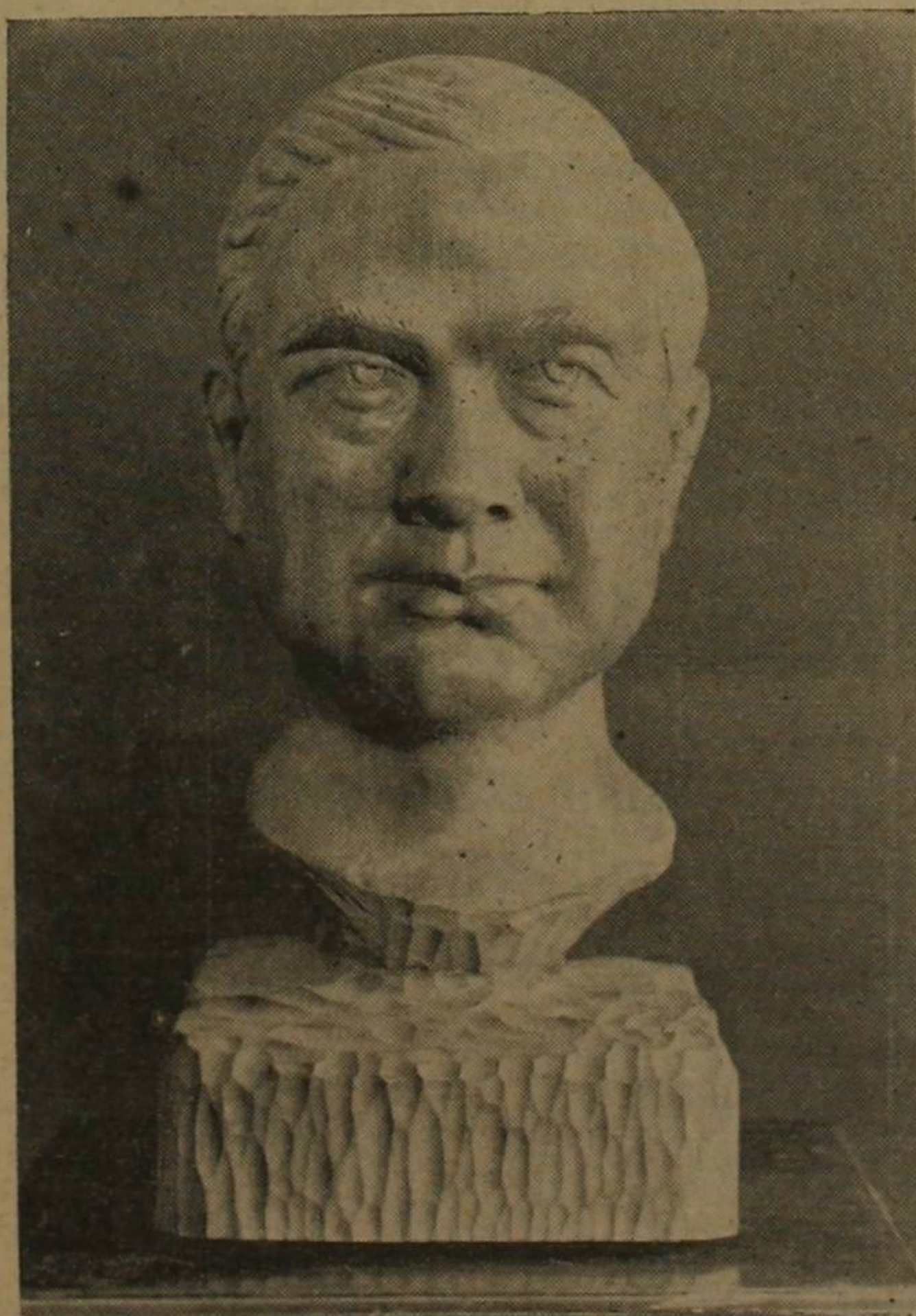
Cabeza de Rubén Darío

Desde luego, los extranjeros— así sean de nuestro propio medio— hallarán extraño y hasta incomprendible a Darío. Fuera del mun-