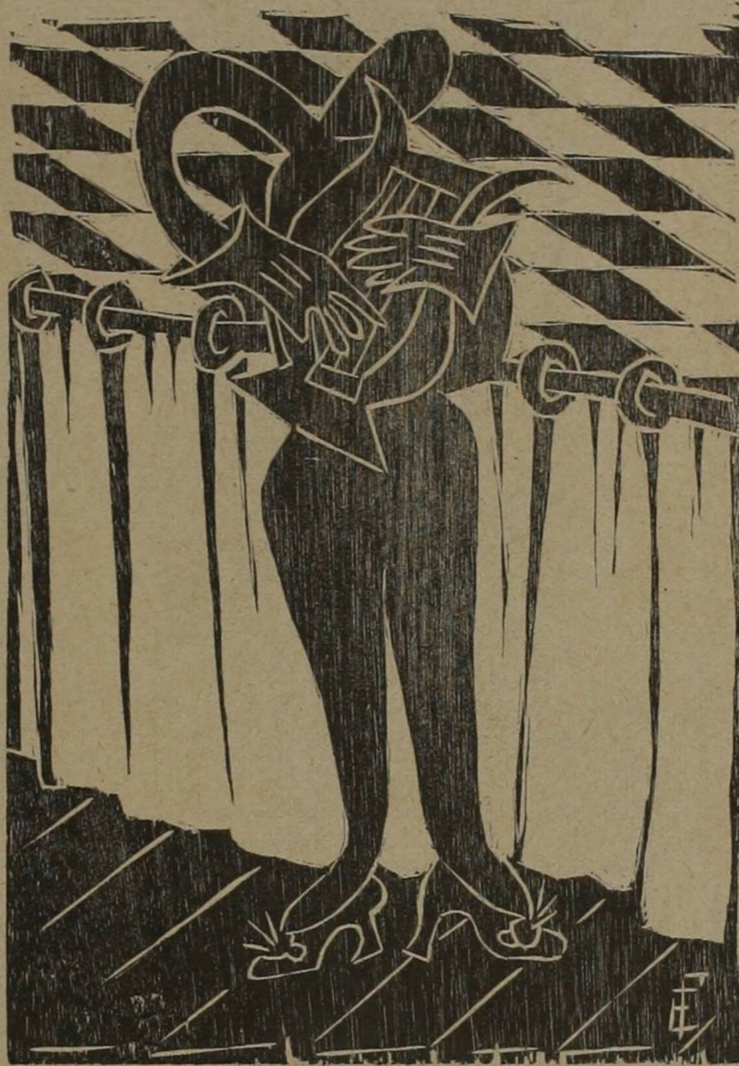
Arte de guante y zapatilla

Hay en estos versos procedimientos ingeniosos para denunciar la crujiente y pesada estupidez en que andamos perdidos. Hay elementos que son verdaderas equivalencias para caracterizar la estulticia y la mentecatez. Recordamos el gracioso recurso de Leo