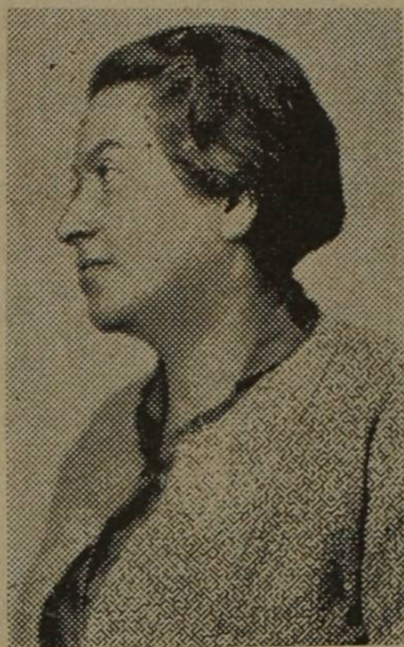
Gabriela Mistral (1931)

Si en Gabriela admiramos el sentimiento maternal entregado a borbotones, hasta un punto que pasma, las mujeres nos sentimos como carne de su carne, porque ésta que en