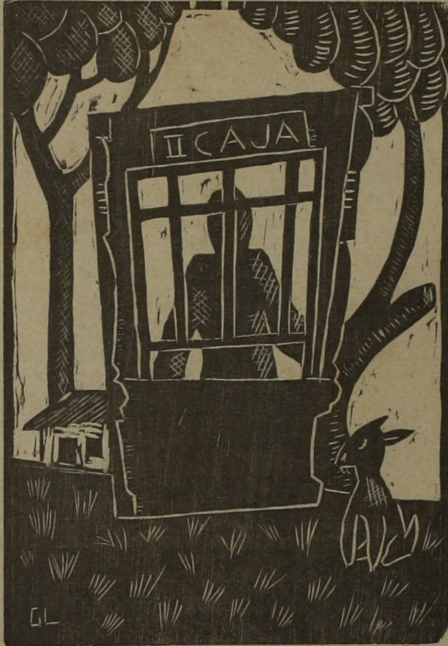
Vive sin saberlo

= De El Sol, Madrid, 25 de febrero de 1936. =