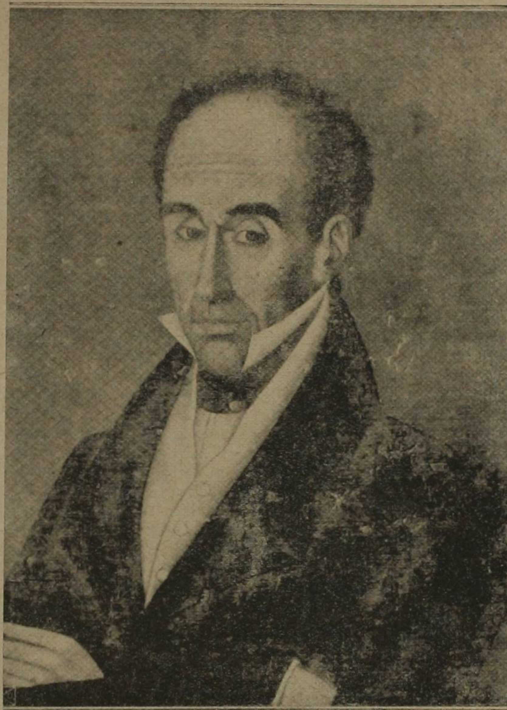
Bolívar en 1830